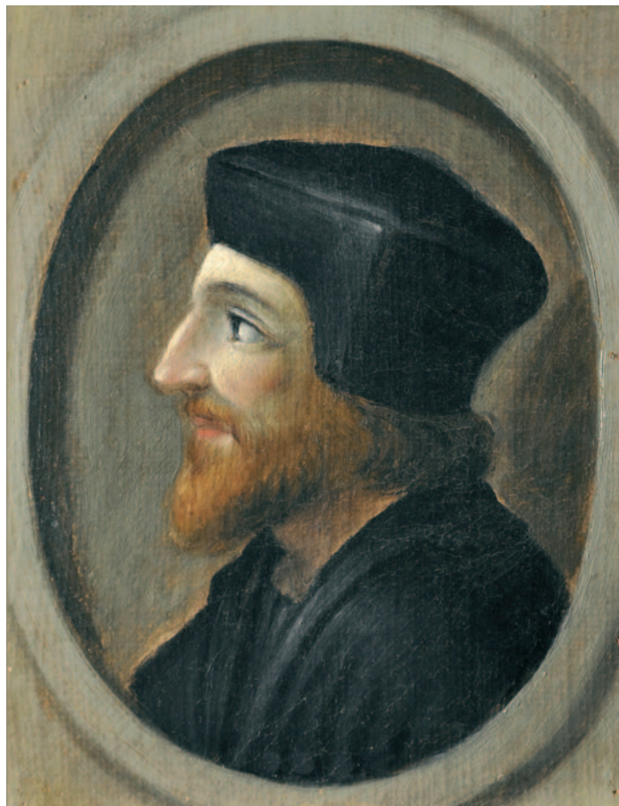
Fig. 1 – ANONIMO DEL XVI SECOLO, Ritratto di Agostino Chigi (Agostino il Magnifico), 1506 ca., olio su tela applicata su tavoletta, Ariccia (RM), Palazzo Chigi, farmacia a