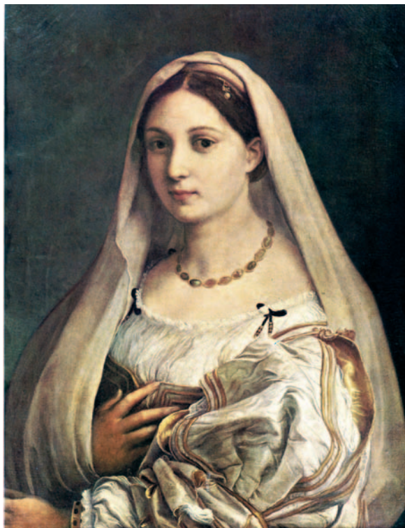
Fig. 9 – RAFFAELLO, Ritratto di donna (la Donna velata ), 1514-1516 ca., olio su tavola, Firenze, Palazzo Pitti, Galleria Palatina