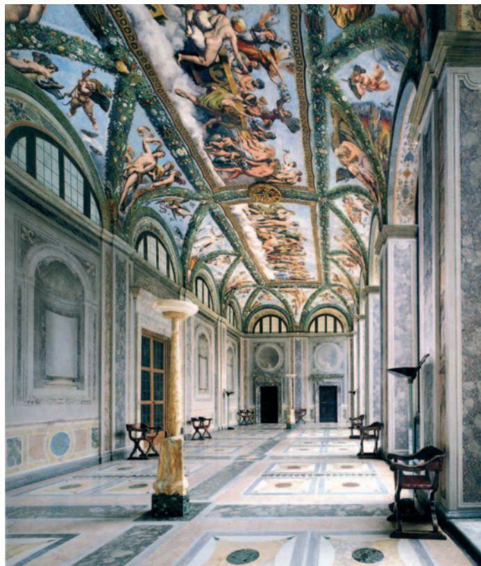
Fig. 2 – RAFFAELLO E BOTTEGA, La Loggia di Psiche da est , 1516-1518 ca., affresco, Roma, Villa Farnesina