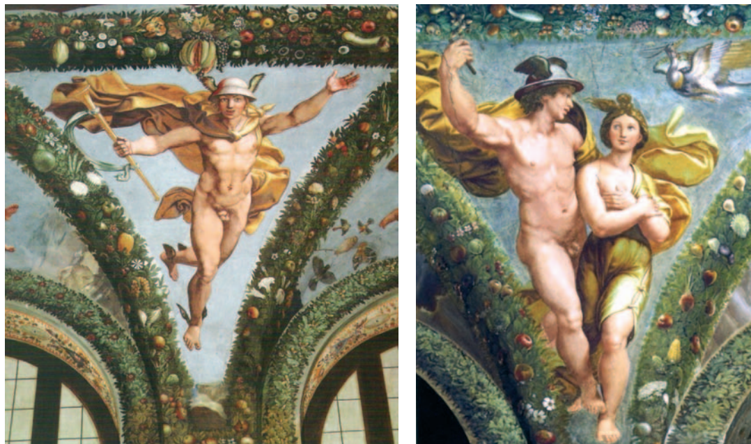
Fig. 4/5 – RAFFAELLO E GIOVANNI DA UDINE, Festoni decorativi (particolari), 1516-1518 ca., affresco, Roma, Villa Farnesina