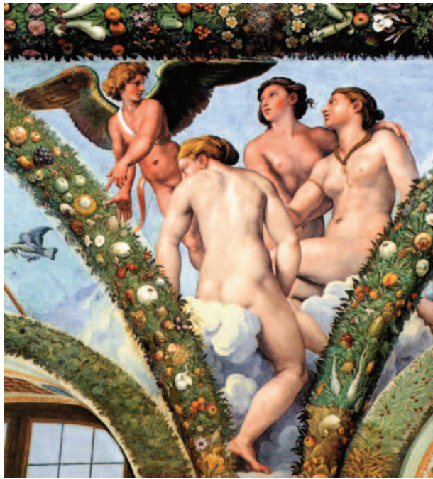
Fig. 6 – RAFFAELLO, Amore e le tre Grazie , 1516-1518 ca., affresco, Roma, Villa Farnesina