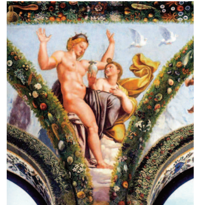
Fig. 7 – RAFFAELLO, Psiche davanti a Venere , 1516-1518 ca., affresco, Roma, Villa Farnesina

Perché Chigi avrebbe incitato il pittore a sperimentare questo tipo di stile, se non per rendere omaggio ai codici culturali e artistici della città di origine della sua sposa, e, nella stessa occasione, saziare il suo desiderio di novità? La Loggia di Psiche è particolarmente improntata al desiderio molto personale del committente di fare direttamente allusione alla sua storia d'amore con Francesca Ordeaschi e non sarebbe