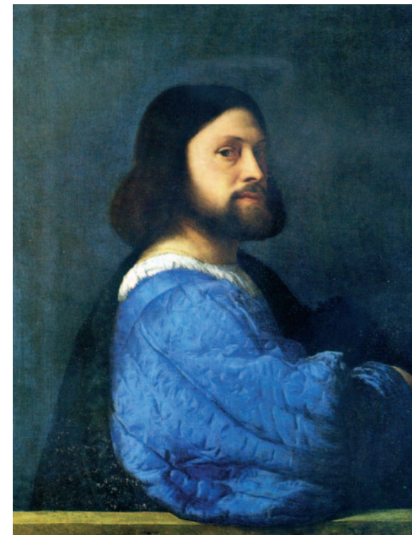
Fig. 9 – TIZIANO, Ritratto di gentiluomo , 1510 ca., olio su tela, Londra (GB), National Gallery

Altri pittori impostano i loro modelli in questo modo, ruotati di tre quarti, con la testa verso lo spettatore, su uno sfondo scuro. Ma gli esperti ritengono che Giorgione