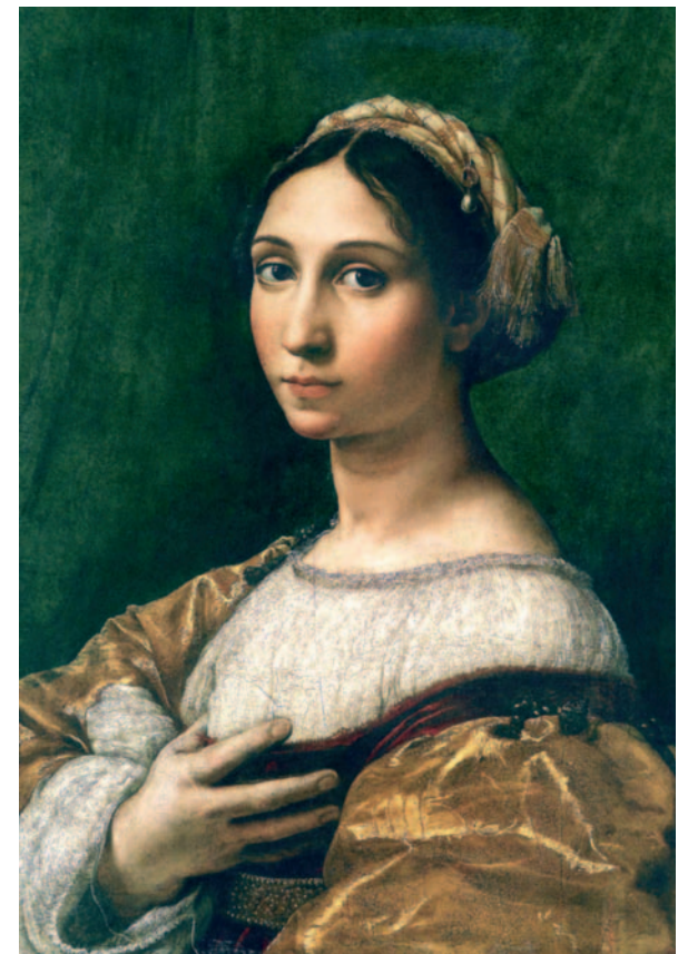
Fig. 11 – RAFFAELLO, Ritratto di donna , 1518 ca., olio su tavola, Strasbourg (FR), Musée des Beaux-Arts

Il mecenatismo di Agostino Chigi è profondamente segnato dalla sua natura di uomo d'affari alla ricerca di innovazioni. Il ricco banchiere è, infatti, alla ricerca di tutto quello che è nuovo, moderno e che può permettergli di essere all'apice di tutto quello che produce il suo tempo, anzi, di essere in anticipo sul suo tempo. Agostino spinge forse Raffaello ad innovare nella sua pittura e sfrutta il suo spirito creativo orientandolo, con le sue commesse e i suoi desideri, verso altre vie conformi ad un mecenatismo di origine borghese. Un nuovo tipo di mecenatismo che somiglia, d'altronde, a quello che era praticato a Venezia e del quale fu, probabilmente, molto sedotto nel corso del suo viaggio nel 1511.