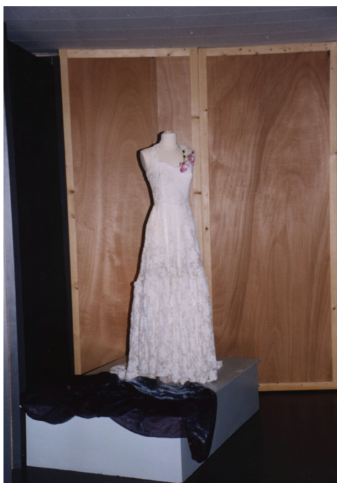
FIG. 3 – La robe de bal de Rose

En entrant au musée, la robe de Rose a été pratiquement vidée de son caractère au point de n'être plus reconnaissable. Franchissant cette porte, elle s'est séparée de ce qui en faisait un objet d'affection : la kinesthésie du bal, le mouvement des danseurs, la musique et la lumière des salons se sont évaporés. Elle a perdu « son identité 28 » car seule sa matière a été transportée au musée. Il ne reste donc à Rose qu'une fiction retrouvée dans un magazine, chargée de réactualiser les sensations d'autrefois. La robe est devenue un rêve, qu'une mémoire sélective et trompeuse a contribué à fabriquer. Elle peut alors devenir une « pièce »