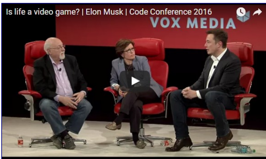
Conférence d'Elon Musk sur la