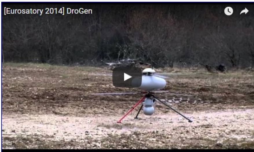
Démonstration des drones du génie

Les recherches sur les drones s'appuient sur de nombreuses études de robotique. Un drone doit pouvoir être adaptatif en fonction de sa mission, de l'environnement et des imprévus. C'est ce que l'on attend, par exemple, des drones de reconnaissance au contact (DRAC) ou du système DroGen (drones du génie). L'intégration des informations est essentielle au bon déroulement d'une mission. Notons que d'une manière générale, les drones ne sont pas plus rapides qu'un opérateur humain dans leur décision, mais plus fiables et plus précis dans l'exécution.