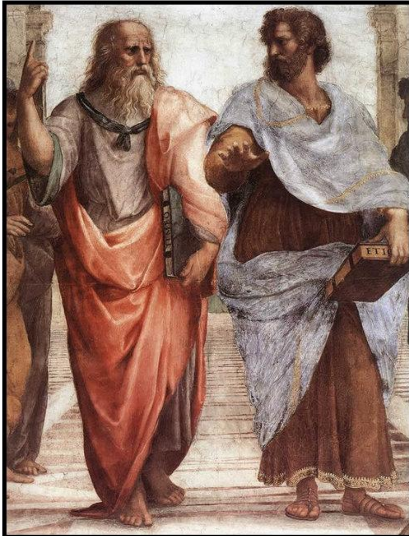
Platon et Aristote discutant 363