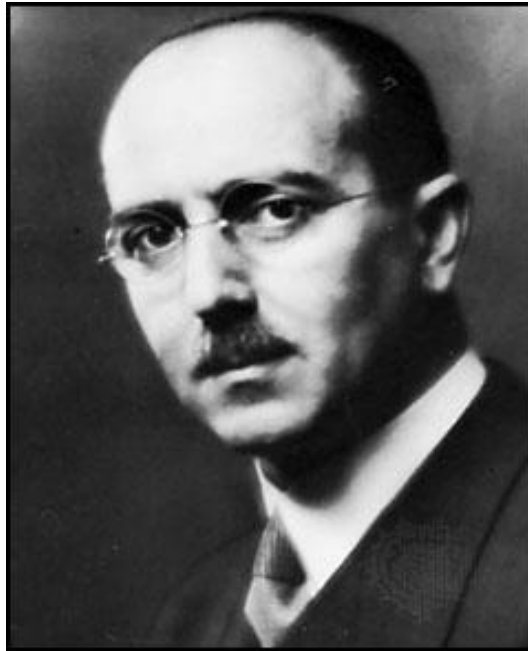
Hans Kelsen 15