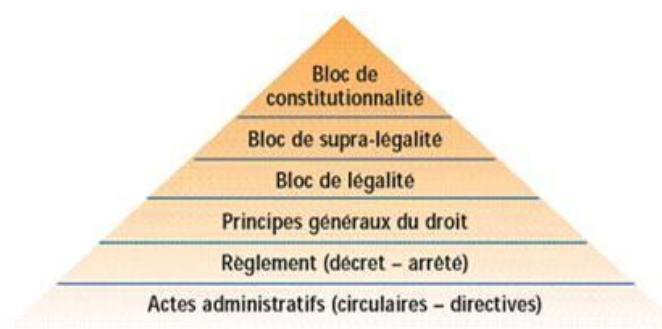
La pyramide des normes 77

l'image de l'arbre 73 . Il emprunte finalement une toute autre métaphore, néanmoins pertinente et entrée dans la postérité du droit en tant que classique : il compare la structure de l'ordre juridique à une pyramide, c'est la « pyramide » des normes 74 . Ainsi, se déploient – du sommet jusqu'à la base – la Constitution originaire, les Constitutions dérivées 75 , les lois et les règlements (décrets ou arrêtés) ; enfin, le rez-de-chaussée de l'édifice kelsenien est formé par les actes administratifs (circulaires ou directives) 76 . Il n'est pas surabondant de préciser qu'évoquer une « pyramide » des normes invite bien souvent à s'intéresser à la hiérarchie de leurs sources. En effet, les développements à venir se concentreront souvent moins sur les normes en elles-mêmes que sur leurs origines.