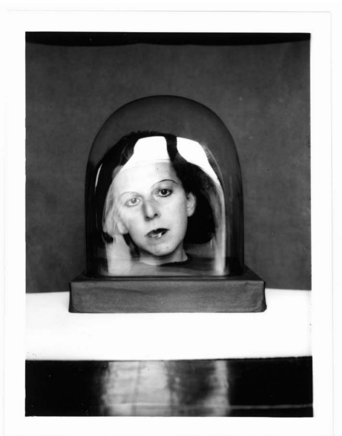
Figure 1 : Claude Cahun, Studies for a Keepsake , vers 1926.

Depuis ce poste d'observation privilégié, cette figure se présente face au spectateur, comme le ferait un acteur du théâtre muet, en jouant de l'expressivité de son regard et de son visage. Le recours à un dispositif qui utilise la matière vitrée pour établir une étroite relation avec le spectateur, tout en plaçant l'objet de la représentation hors de sa portée, semble d'emblée poser qu'une forme de résistance est à l'œuvre au cœur du processus d'invention de soi, ce qui engage à penser que l'acte même de résister aux clivages normés (et en premier lieu celui du féminin/masculin) dépend de mouvements ou de frottements, au sens mécanique du terme, opérant à l'intérieur de l'image. Partant, se dessinent les potentialités de ce que l'on pourrait