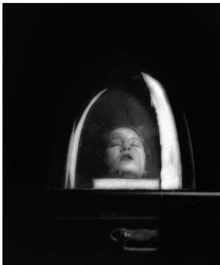
Figure 3 : Lee Miller, Tanja Ramm and Bell Jar . Variant on Hommage à D. A. F. de Sade , vers 1930.

découvre un regard évoquant un état au-delà de la conscience, voire de l'existence corporelle. L'œil droit entrouvert et les traits du visage parfaitement relâchés nous placent devant l'image d'une rupture fondamentale (extase orgasmique et/ou mort). Peut-être faut-il y voir une illustration de la « beauté convulsive », métaphore chez Breton de l'objet considéré « dans son mouvement et dans son repos », au moment de « l'expiration exacte [du] mouvement même 19 », et signe de l'automatisme psychique pur ? Ou encore l'exhibition d'une décapitation rituelle dont la vue nous transporte vers le sentiment du sacré ? La mutilation ou le sacrifice, en remettant en cause l'intégrité du sujet féminin, ouvrent à la conscience de son « tout autre ». On ne serait pas loin ici du projet bataillien de réveiller en l'homme le sens de « l'élevé » pour le placer « à hauteur d'impossible » ou, comme l'écrit Bataille d'atteindre à ce point qu'il décrit comme :