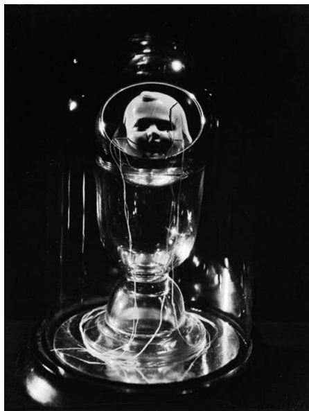
Figure 4 : Lee Miller, Untitled. Object by Joseph Cornell , 1933.

Une tête de chérubin androgyne (ou asexué) a été déposée dans une sorte de coupelle (en réalité la demi-sphère déjà utilisée dans Twelve Needles ), elle-même placée dans un verre à liqueur. Le visage de l'ange est percé de trois aiguilles à coudre dans le chas desquelles passent trois fils à repriser de couleur blanche dont l'extrémité pend au pied du verre. Ce dernier se reflète sur le socle brillant du globe de mariée enfermant le tout. Cet assemblage complexe détonne parmi les objets sous cloche construits par Joseph Cornell, à la même période ou par la suite. D'une part, sa composition semble beaucoup moins assujettie à l'iconographie surréaliste « convenue » qui se retrouve souvent, à l'époque, dans ce type de construction (comme le métronome, la main, l'œil ou l'insecte). D'autre part, le recours à la photographie suggère que l'artiste souhaitait conserver une trace de son travail, voire le préserver hors d'atteinte du temps 26 .