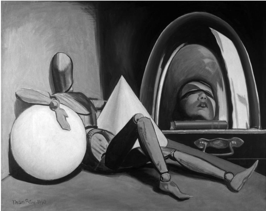
Figure 5 : Man Ray, Aline et Valcour , 1950.

déjà convoqué en 1926 dans la photographie Mannequin avec cône et sphère , vient se substituer à la figure humaine : une première fois en 1932, dans un collage photographique intitulé Lydia et les mannequins , puis en 1950, dans un tableau, Aline et Valcour , qui tous deux reprennent le thème de la femme décapitée et/ou du jeu d'échecs, et font référence plus ou moins directement à Hommage à D. A. F. de Sade .