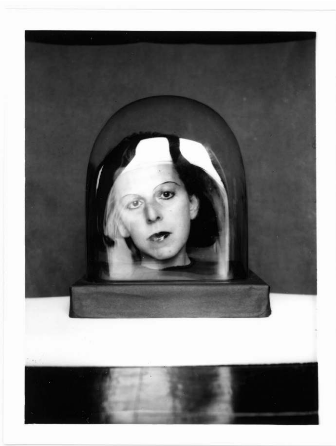
Figure 1 : Claude Cahun, Studies for a Keepsake , vers 1926.

Depuis ce poste d'observation privilégié, cette figure se présente face au spectateur, comme le ferait un acteur du théâtre muet, en jouant de l'expressivité de son regard et de son visage. Le recours à un dispositif qui utilise la matière vitrée pour établir une étroite relation avec le spectateur, tout en plaçant l'objet de la représentation hors de sa portée, semble d'emblée poser qu'une forme de résistance est à l'œuvre au cœur du processus d'invention de soi, ce qui engage à penser que l'acte même de résister aux clivages normés (et en premier lieu celui du féminin/masculin) dépend de mouvements ou de frottements, au sens mécanique du terme, opérant à l'intérieur de l'image. Partant, se dessinent les potentialités de ce que l'on pourrait