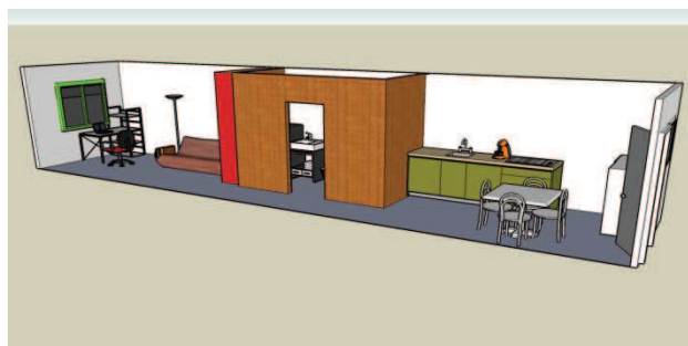
Illustration n°1. Exemple de solution (Solution D1-A4)