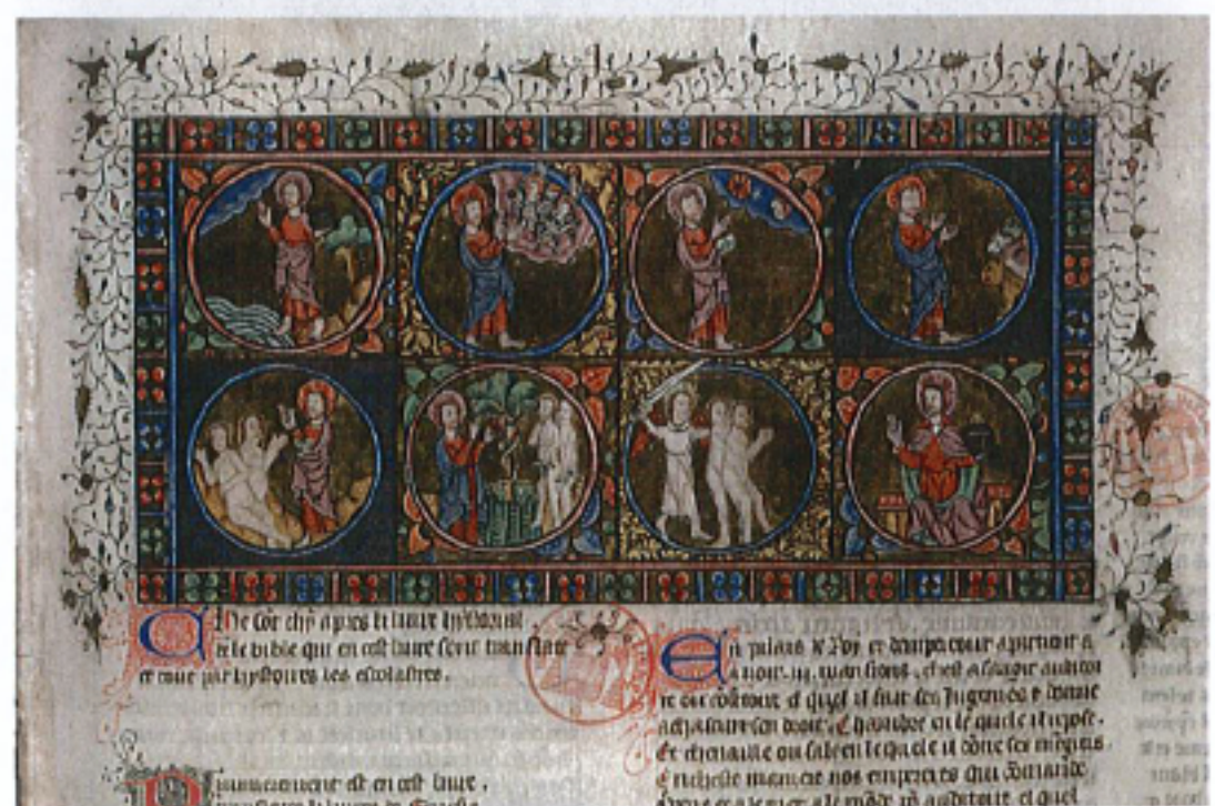
FIG. 17 – Paris, Bibliothèque Mazarine, manuscrit 312, fol. 1r. « La Création ».