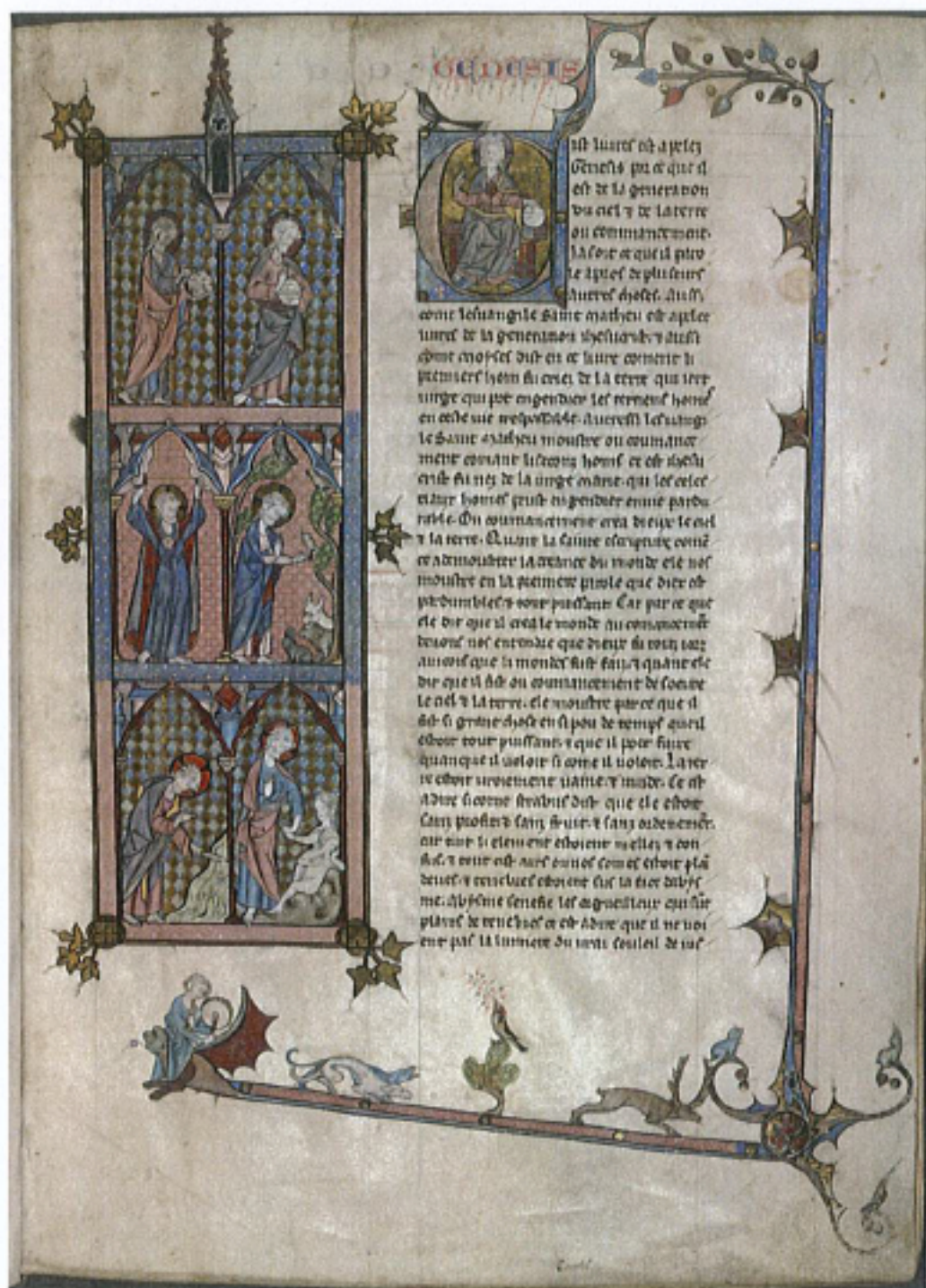
FIG. 27 – Londres, British Library, manuscript Harley 616, fol. 1r. : « La Création ».