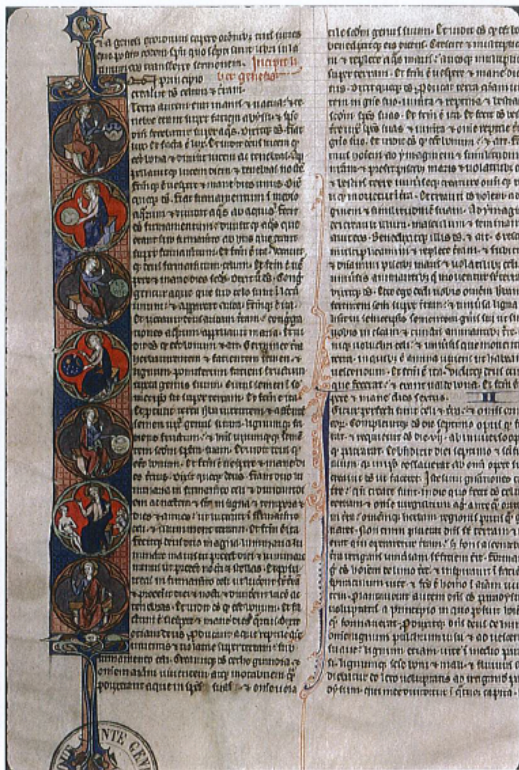
FIG. 14 – Paris, Bibliothèque Sainte-Geneviève, manuscrit 1181, fol 3v. « La Création ».