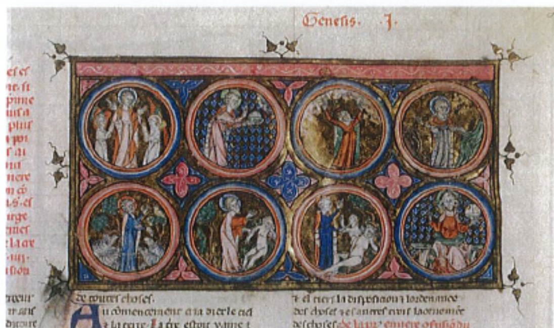
FIG. 16 – Paris, BnF, manuscrit fr. 155, fol. 2r. : « La Création ».