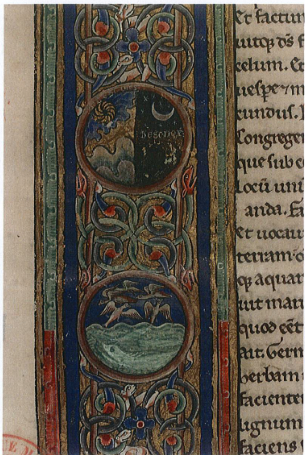
FIG. 15 – Paris, Bibliothèque Mazarine, manuscrit 40, fol. 1r. « La Création ».