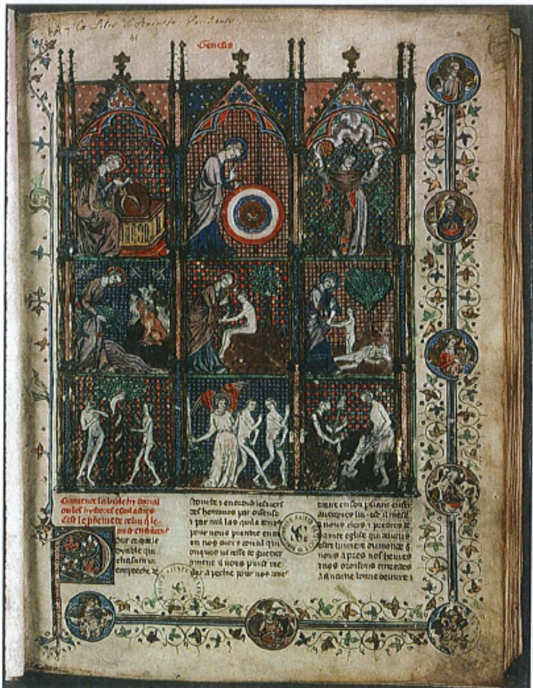
FIG. 18 – Paris, Bibliothèque Sainte-Geneviève, manuscrit 20, fol. 1r. « La Création ».