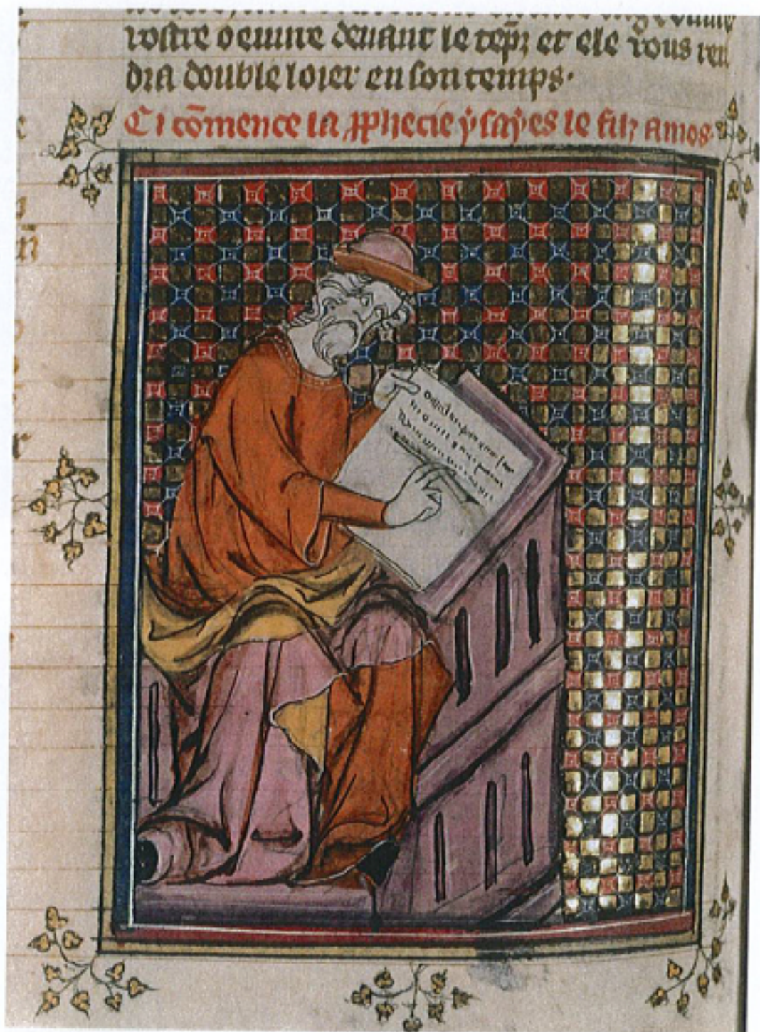
FIG. 25 – Paris, BnF, manuscrit fr. 8, fol. 272v : « Scribe à son pupitre ».