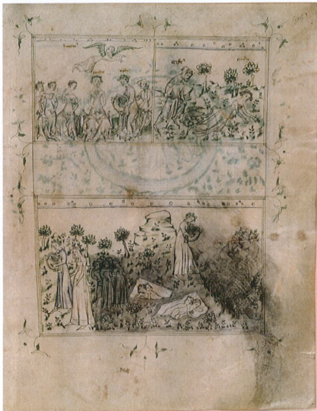
FIG. 30 – Paris, BnF, manuscrit fr. 871, fol. 196r. : « Orphée ».