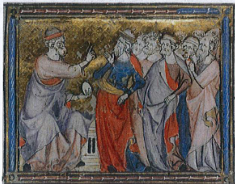
FIG. 4 – Rouen, Bibliothèque municipale, manuscrit O. 4, fol. 17r. Collections de la Bibliothèque municipale de Rouen : « Ovide enseigne l'univers grâce à l'image de l'œuf ».