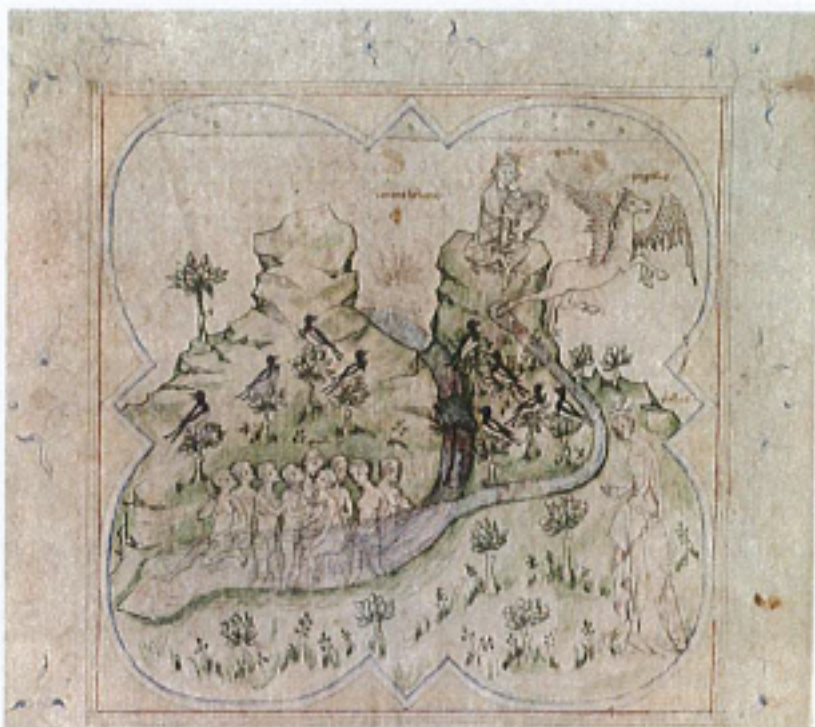
FIG. 29 – Paris, BnF, manuscrit fr. 871, fol. 116v. : « Apollon, Pégase, les Muses et les Piérides ».