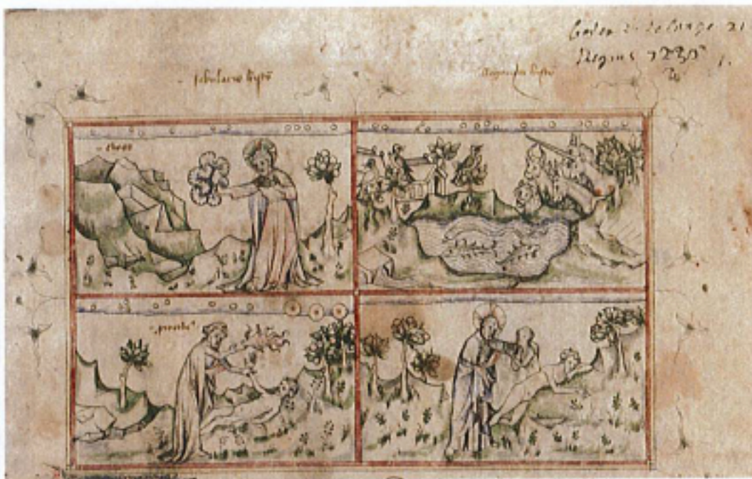
FIG. 11 – Paris, BnF, manuscrit fr. 871 fol. 1r. (détail) « Dieu créateur et Prométhée ».