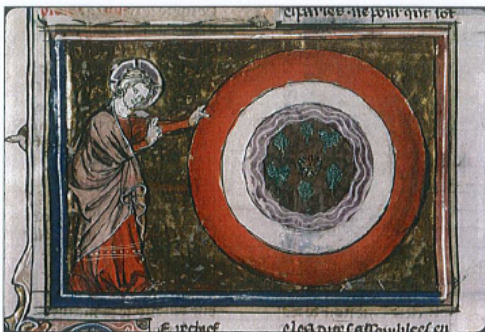
FIG. 19 – Paris, Bibliothèque Sainte-Geneviève, manuscrit 20, fol. 4v. « Dieu sépare les éléments ».