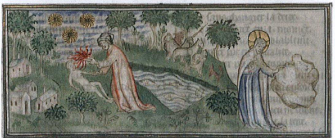
FIG. 10 – Lyon Bibliothèque municipale, manuscrit 742, fol. 4r. « Dieu créateur et Prométhée ».