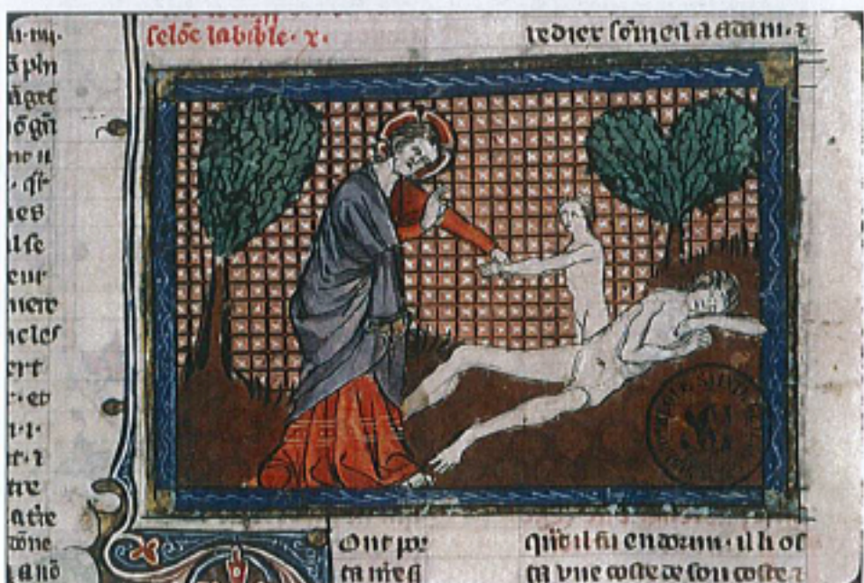
FIG. 20 – Paris, Bibliothèque Sainte-Geneviève, manuscrit 20, fol. 8r. « La Création de la femme ».