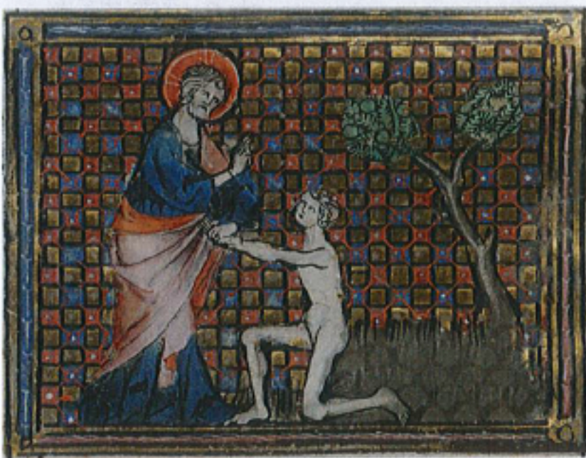
FIG. 24 – Rouen, Bibliothèque municipale, manuscrit O. 4, fol. 18r. Collections de la Bibliothèque municipale de Rouen : « La Création de l'homme ».