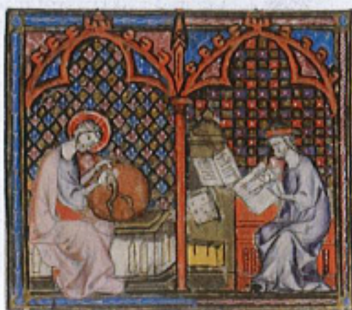
FIG. 2 – Rouen, Bibliothèque municipale, manuscrit O. 4, fol. 16v. Collections de la Bibliothèque municipale de Rouen : « Dieu au compas et scribe à son pupitre ».