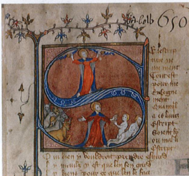
FIG. 12 – Paris, BnF, manuscrit fr. 872, fol. 1r. : « La Création ».