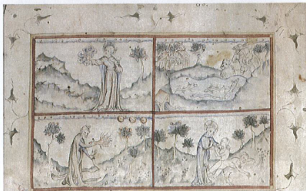
FIG. 28 – Londres, British Library, manuscrit Add. 10324, fol. 1r. : « Dieu créateur et Prométhée ».