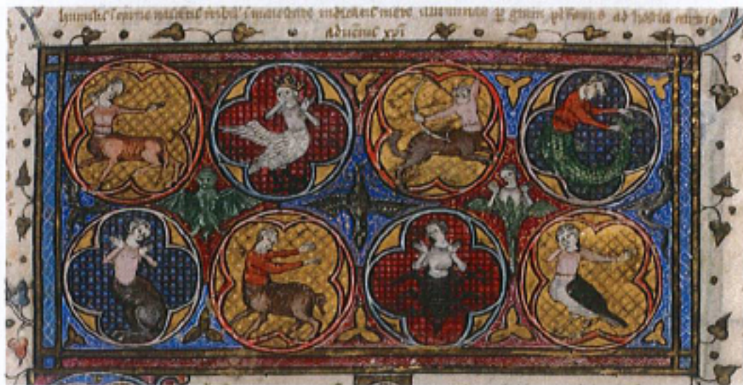
FIG. 1 – Rouen, Bibliothèque municipale, manuscrit O. 4, fol. 16r. Collections de la Bibliothèque municipale de Rouen : « Frontispice ».