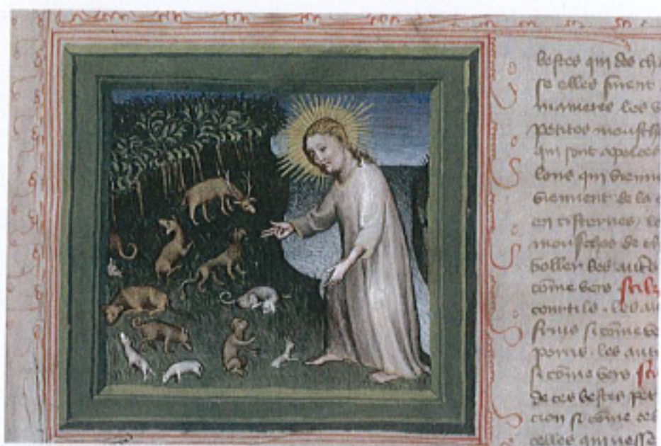
FIG. 21 – Paris, Bibliothèque Mazarine, manuscrit 313, fol. 6r. « La Création des animaux ».