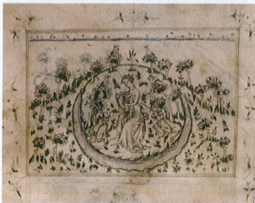
FIG. 31 – Paris, BnF, manuscrit fr. 871, fol. 196v. (© BnF) : « Orphée ».