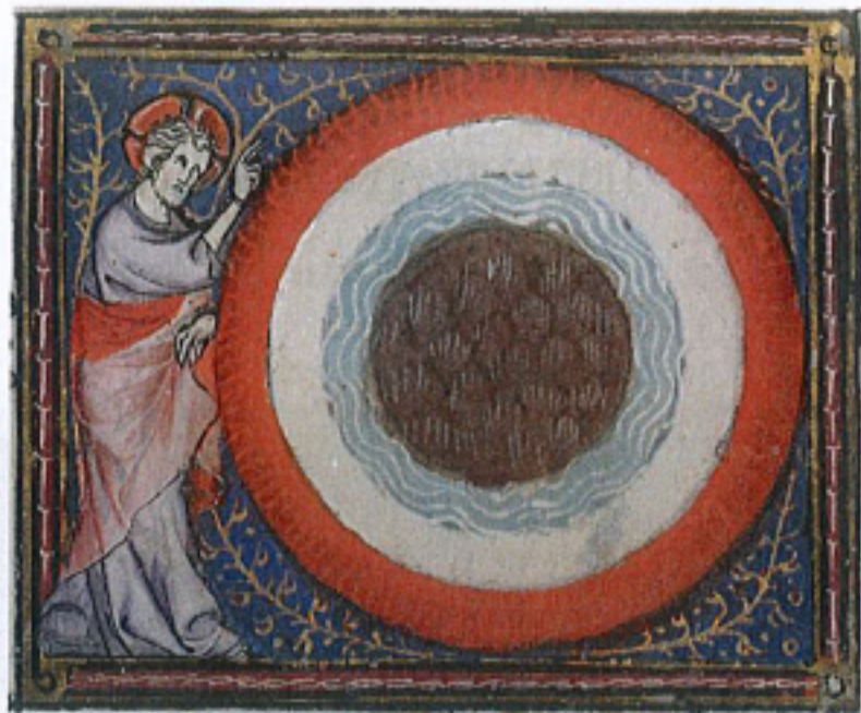
FIG. 3 – Rouen, Bibliothèque municipale, manuscrit O. 4, fol. 17r. Collections de la Bibliothèque municipale de Rouen : « Dieu sépare les éléments ».