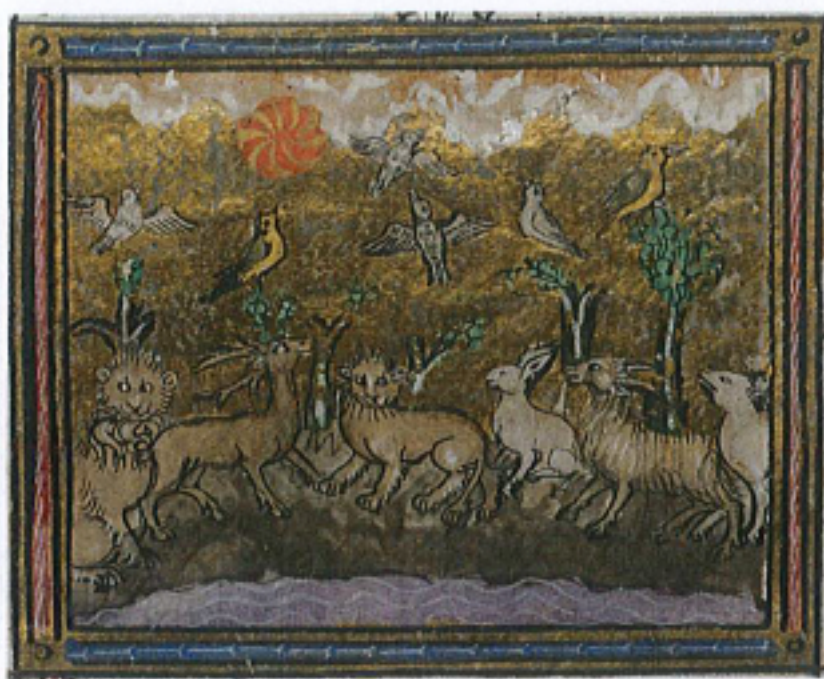
FIG. 23 – Rouen, Bibliothèque municipale, manuscrit O. 4, fol. 18r. Collections de la Bibliothèque municipale de Rouen : « La Création des animaux ».