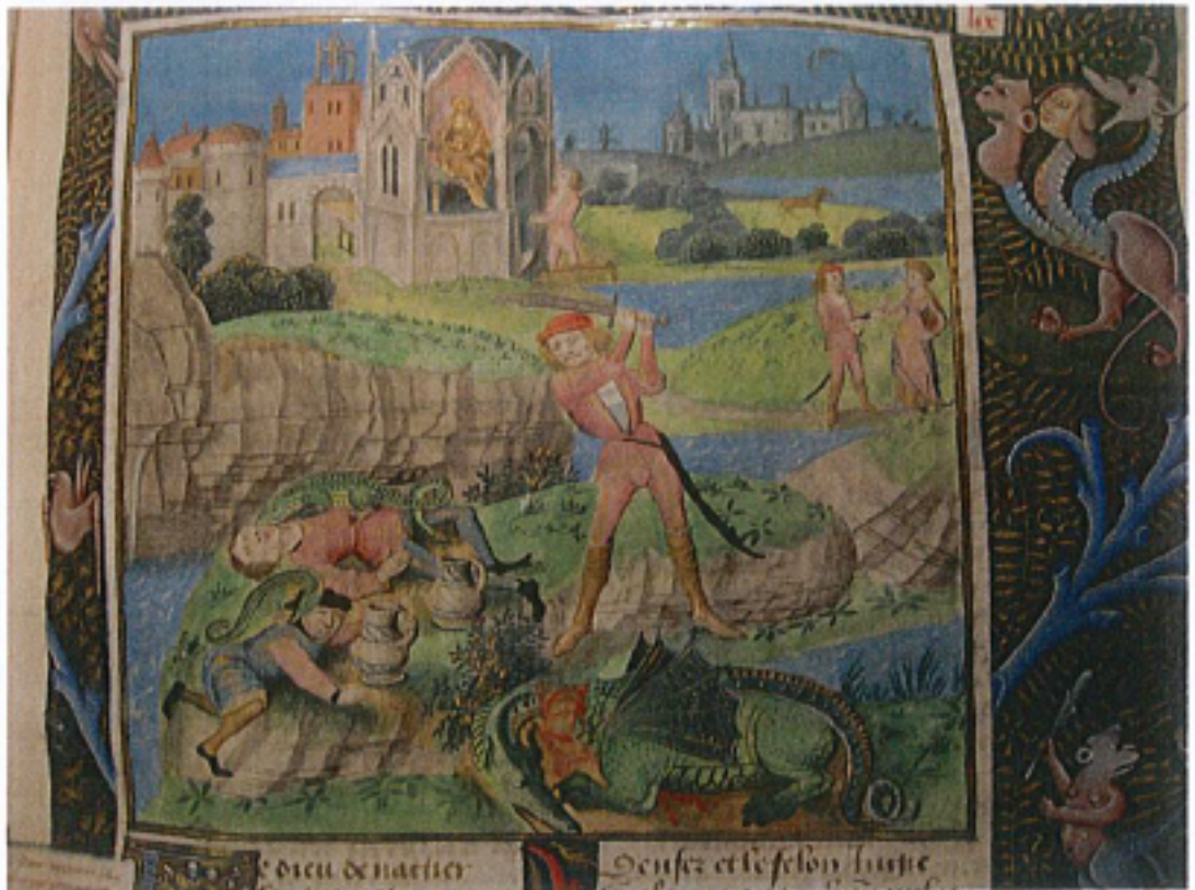
FIG. 9 – Copenhague, Bibliothèque royale, manuscrit Thott 399, fol. 89r. « Frontispice : Cadmus combat le dragon ».