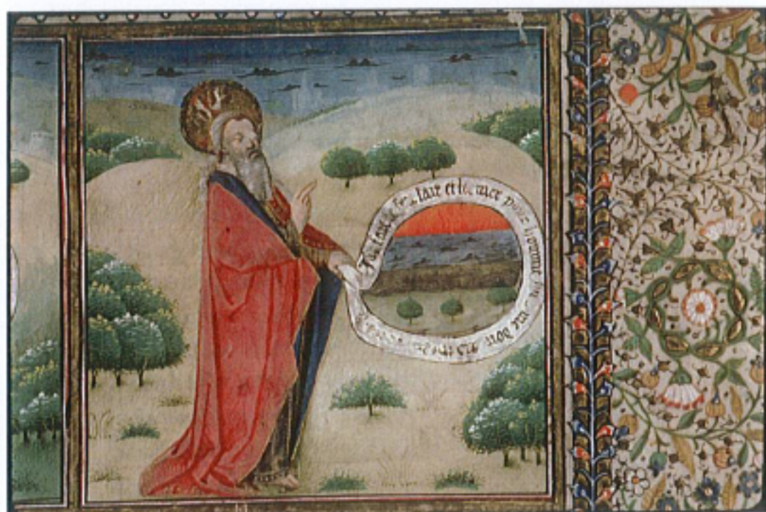
FIG. 26 – Amiens, Bibliothèques d'Amiens Métropole, manuscrit 399 F, fol. 1r. « Dieu sépare les éléments ».