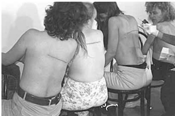
Línea de 160 cm tatuada sobre 4 personas

L'extrême crudité de l'échange commercial qui se réalise dans la performance place l'artiste simultanément dans la position du dealer et du client de ces prostituées héroïnomanes, puisqu'il achète leur corps en échange de drogue. Par ailleurs, l'intervention de Santiago Sierra s'auto-désigne comme une abstraction, car c'est le tatouage d'une ligne, dont la longueur est quantifiée, qui donne le titre à la performance. L'abstraction minimaliste de la mesure d'un segment de ligne vient ainsi se substituer, pour l'exacerber encore, à la matérialité de la peau, de la drogue qui va être injectée certainement peu après la réalisation de performance, et plus généralement à la misère humaine dans la dégradation physique et morale. On peut également interpréter cette abstraction comme l'anéantissement de tout espoir de salut : il ne s'agit pas pour l'artiste de sauver des individus et l'art doit se savoir en la matière complètement impuissant. Sierra choisit donc de rejouer l'aliénation dans un dispositif artistique sans proposer aucune issue, c'est-à-dire aucune tentative de changement ou de subversion de la situation initiale.