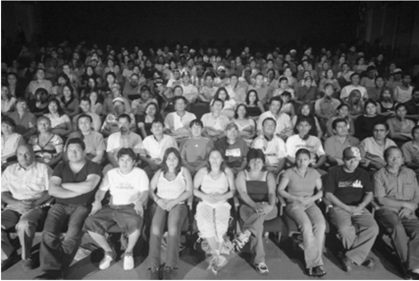
La trampa, Santiago de Chile, 2007

La présence du groupe de travailleurs péruviens est annoncée dans la performance comme hors de tout cadre de rémunération, et Santiago Sierra fait donc intervenir pour la première fois des individus qui incarnent à la fois le prolétariat et les opprimés comme des sujets et non plus comme des acteurs liés par la dépendance économique. Par ailleurs, le groupe des notables qui concentrent le capital économique ou symbolique est lui aussi manifestement volontaire. Le titre de l'oeuvre, La trampa , est à cet égard éloquent, car l'artiste se montre à présent rusé, manipulateur des forts non plus dominateur ou exploiteur des faibles. Santiago Sierra a ici à visiblement renoncé à endosser sur la scène symbolique de la performance le rôle de l'exploiteur et donc du coupable. En rendant leur entière responsabilité à ceux que Santiago Sierra juge coupables de la misère du monde, l'artiste a rapproché l'art de la vie, dans une performance qui met face à face dominants et dominés hors de la logique du simulacre et de la réduplication du mal. Toujours en 2007, au Mexique cette fois, Santiago Sierra a fait lire (là encore sans rémunération) une liste de 1549 noms de citoyens mexicains tués par la police ou l'armée lors d'épisodes de violences politiques depuis 1968. Cette performance, qui s'intitule 1549 crímenes de estado , pose là encore la question de l'oppression en dénonçant la raison d'État et en désignant explicitement l'état mexicain comme meurtrier 30 . Ces deux