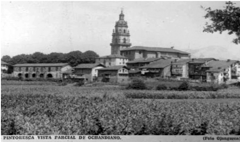
«Pintoresca vista parcial de Ochandiano», El Noticiero Bilbaíno , 11 de noviembre de 1936, p. 1.

La Primera Guerra Mundial se convierte en un referente que orienta las principales representaciones que se transmiten sobre la guerra en Euzkadi. Otras prácticas comunicativas lo corroboran asimismo, tales como la publicación en la prensa nacionalista y en los diarios incautados por las autoridades vascas —o incluso en la prensa rebelde— de numerosas fotografías a primera vista anacrónicas, pero cuya dimensión simbólica articula un discurso esencial para forjar una imagen distinta de la guerra y de sus consecuencias.