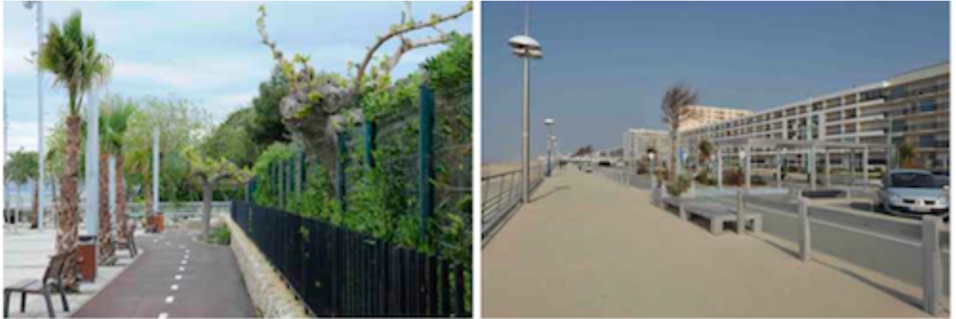
Exemples de photographies incorporées à la série des photographies de stations littorales : A5 : Cambrils ; A27 : Saint Jean de Monts.

Si la photographie trahit inévitablement le point de vue du photographe, de l' Operator , elle permet également de révéler celui du Spectator , le touriste :