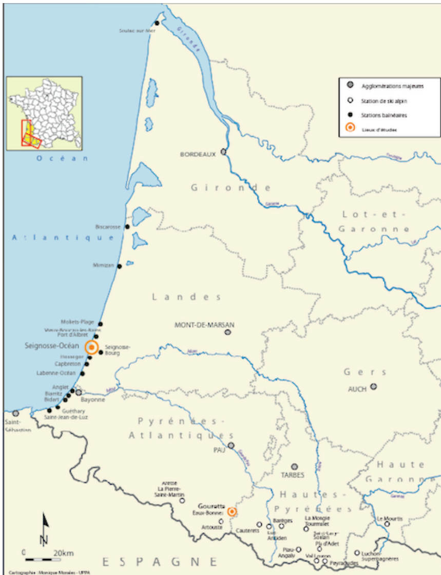
Les principales stations littorales et de montagne du Sud-ouest français (Cartographie : Monique Morales, UPPA).