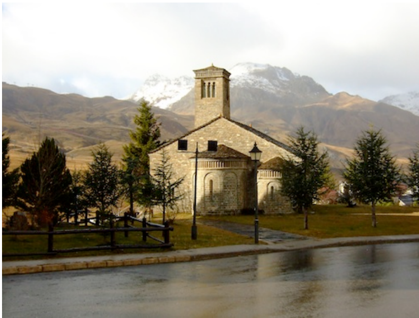
Image de Formigal non intégrée à la série des photographies de stations de montagne (Vlès, 2008).

Le corpus ainsi constitué a été soumis à l'enquêté, en deux temps, pour un double classement libre des photographies (Hatt, 2010, Vlès et alii , 2009). L'enquêté est d'abord confronté à la série T1 et doit opérer un classement des images en plusieurs catégories selon ses propres critères d'analyse 13 qu'il explicitera postérieurement. Aucune indication ou consigne ne lui est fournie si ce n'est celle de constituer au moins cinq groupes de photographies de façon à éviter l'écueil d'une bipolarisation (négatif/positif). L'enquêté est laissé libre d'évaluer les images qui lui sont soumises, de construire son système de classement et de dénommer avec ses propres mots chacune des catégories créées à l'issue de cette phase. Il s'agit d'éviter dans la mesure du