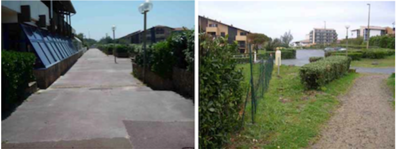
Représentations divergentes des espaces de déambulation, Seignosse-Océan. B36 : identifiée comme « répulsive » par 44% des enquêtés, comme « neutre » par 26% et comme « attractive » par 30% ; B22 : identifiée comme « répulsive » par 52% des enquêtés, comme « neutre » par 26% et comme « attractive » par 22%.