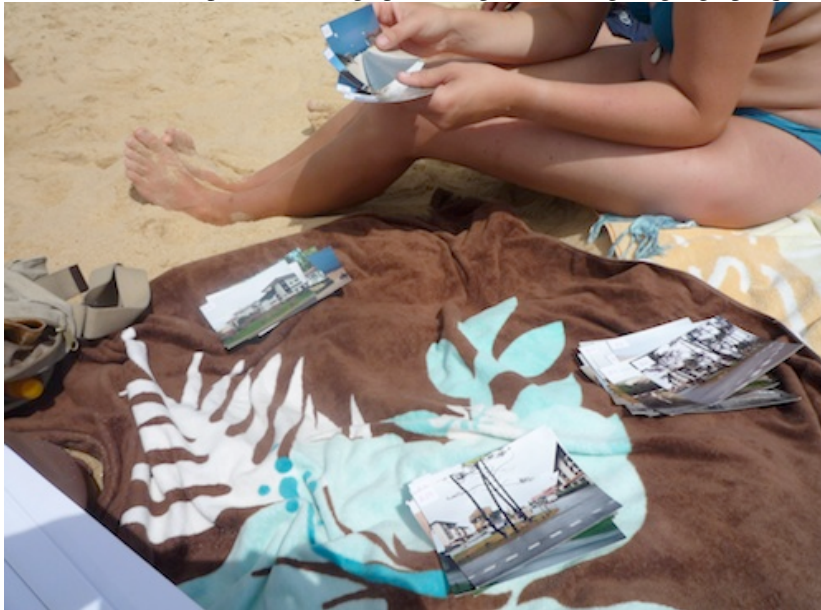
L'enquêté en action : classement photographique à Seignosse-Océan (Hatt, 2009).

Les enquêtes photographiques ainsi conçues ont été menées auprès de soixante individus présents dans la station de Seignosse-Océan durant l'été 2009 (parmi lesquels cinquante-six touristes) et de cinquante personnes à Gourette durant l'hiver 2010 (parmi lesquelles quarante-cinq touristes). Toutes les enquêtes littorales se sont déroulées en un lieu central de la station : la plage du Penon. Elles ont donné la parole à un type de touriste fréquemment raillé, véhiculant tous les stéréotypes négatifs du « bronzeur idiot ». De plus, ce choix obéissait également à des exigences pratiques. La mise en œuvre d'un tel dispositif d'enquête exige en effet de disposer de place (pour effectuer le classement des 134 ou 135 photographies) et de trouver des enquêtés désœuvrés, susceptibles de passer en moyenne une heure à effectuer l'enquête ; la plage était de ce point de vue un endroit stratégique. Les enquêtés ont été choisis au hasard, selon un mode d'échantillonnage sur site (Lanquar, 1990), en tâchant d'ouvrir le panel à un large public (âge, sexe, origine géographique, etc.).