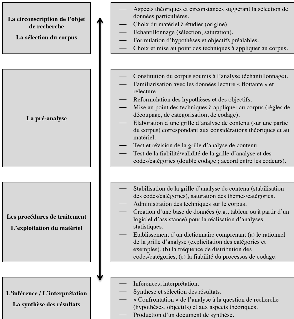
Figure 1. Les différentes étapes de l'analyse de contenu (adapté de Bardin, 1997, 2003 ; Bauer, 2012 ; Robert et Bouillaguet, 2007, Schreier, 2014)