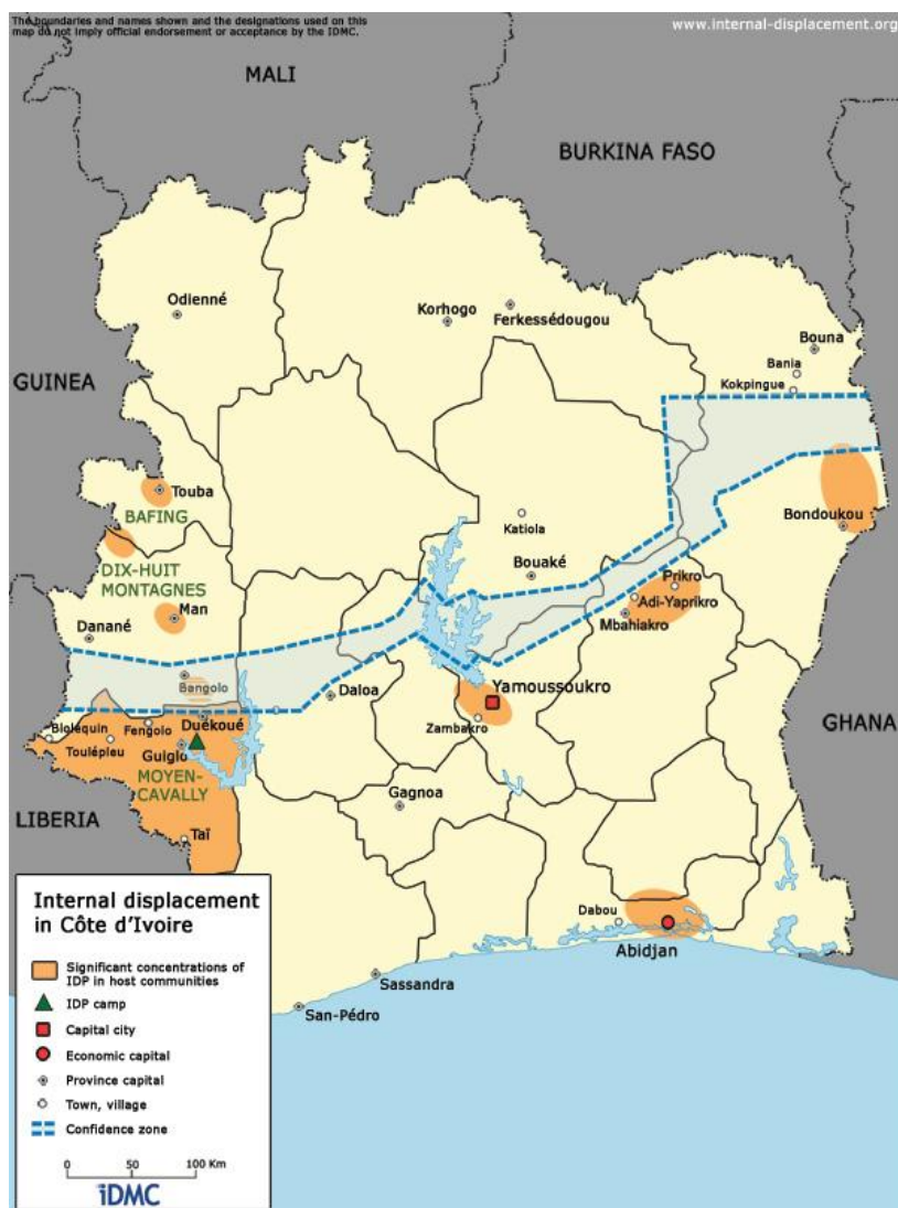
Figure 1 : Carte de la Côte d'Ivoire présentant la ligne de partition du pays et les zones de déplacements principales (2003-2007)

À la fin des années 2000, l'ouest ivoirien avait internalisé une telle culture de violence que chaque problème social (peu importe la cause) se transformait rapidement en une occasion nouvelle de conflit et que les tensions intercommunautaires - déjà présentes avant-guerre - ne s'en trouvaient que plus exacerbées. La violence et l'intimidation s'étaient ainsi tant diffusées qu'il était devenu très difficile, voire impossible, de dissocier les formes structurelles de violence intercommunautaires des violences liées à la guerre, ce qui rendait d'autant plus difficile l'identification des ex-combattants à réinsérer. Le processus DDR ivoirien en effet, à l'instar de tant d'autres, a peiné à intégrer la diversité de profils des ex-combattants et la fluidité des appartenances en préférant une approche "simple",