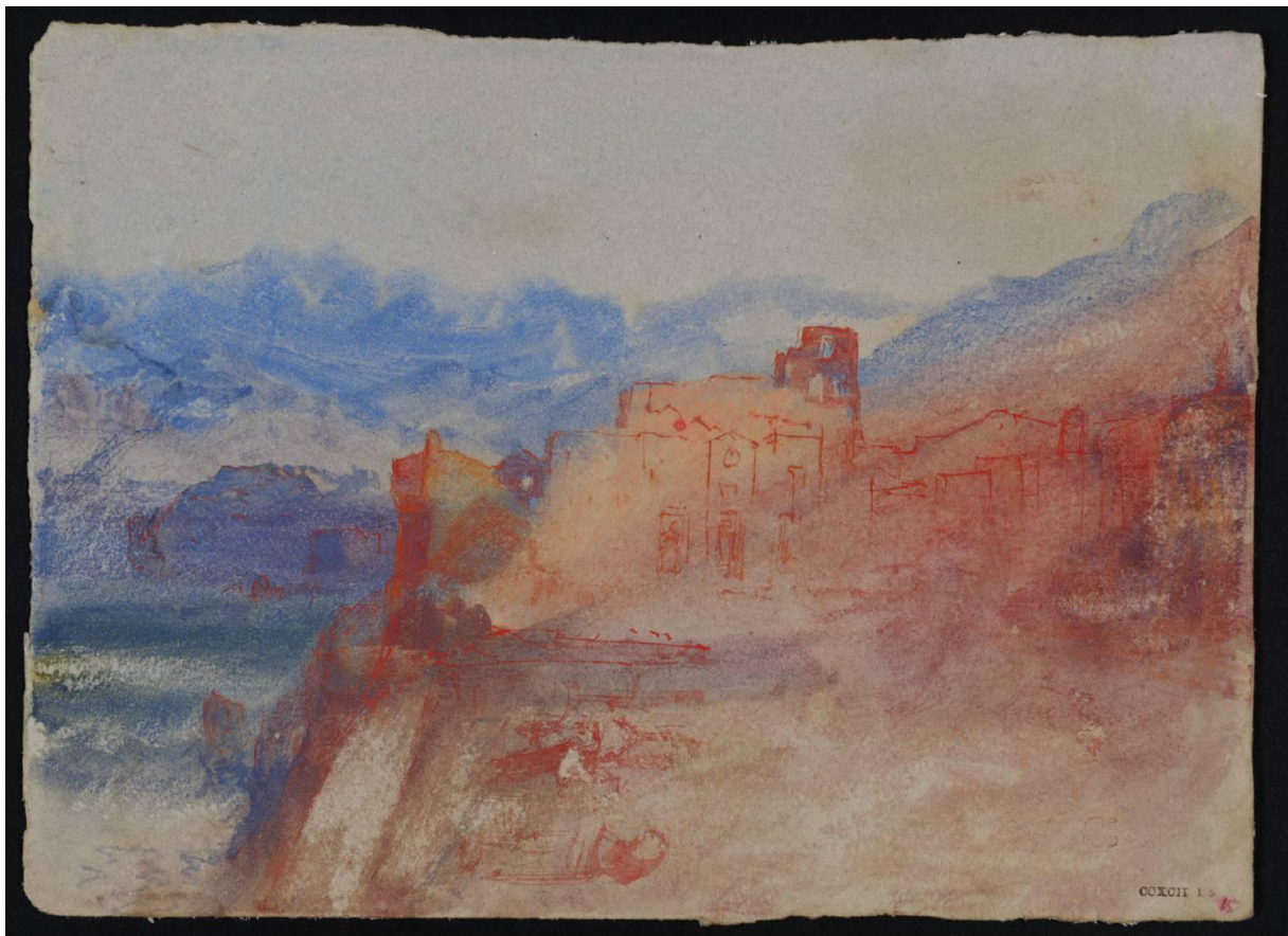
Fig.1 Waterside Buildings and Mountains, ?South of France or Italy c.1834 Legs Turner CCXCII 15 D28962 Tate Gallery Londres iv (137 x 190 mm)

http://www.tate.org.uk/art/artworks/turner-waterside-buildings-and-mountains-south-of-france-or-italy-d28962