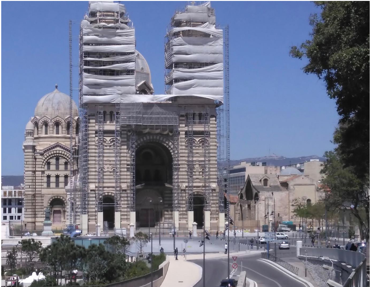
Fig.3: La nouvelle et la vieille Major aujourd'hui, vues approximativement du point de vue de Turner depuis la place de la Tourette disparue : on distingue à peine le cœur de la vieille Major, sur le côté E de la nouvelle cathédrale