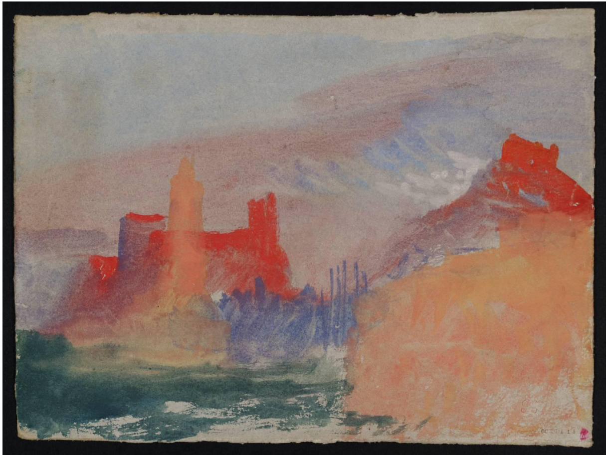
Fig.4 : Coastal Terrain and Buildings, ?South of France or Italy ? Legs Turner Carnet CCXCII 18, D28965, Tate Gallery Londres (144 x 188mm)

www.tate.org.uk/art/artworks/turner-vermilion-towers-d28965