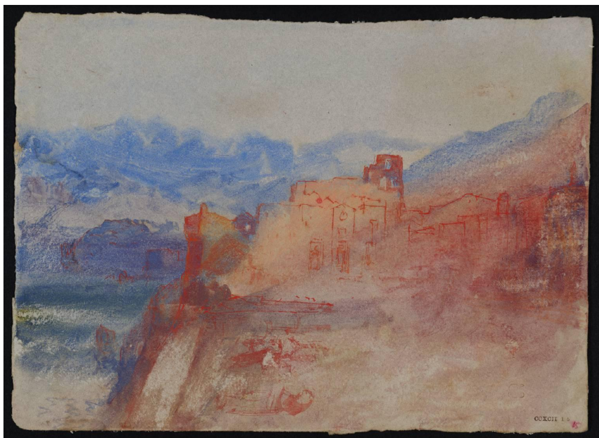
Fig.1 Waterside Buildings and Mountains, ?South of France or Italy c.1834 Legs Turner CCXCII 15 D28962 Tate Gallery Londres iv (137 x 190 mm)

http://www.tate.org.uk/art/artworks/turner-waterside-buildings-and-mountains-south-of-france-or-italy-d28962