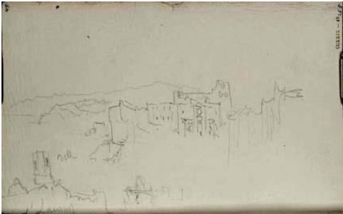
Fig.2 : « St Laurent [Turner] (?St Laurent-d'Aigouze, between Nîmes and Aigues-Mortes) » Legs Turner Carnet CCXXIX 45, « D'Orléans à Marseille », D28986, Tate Gallery, Londres (179 x 117mm) http://www.tate.org.uk/art/artworks/turner-st-laurent-turner-st-laurent-dai gouze-between-nimes-and-aigues-mortes-d20986 , CC-BY-NC-ND 3.0 (Unported)

Bien qu'on parle généralement des « aquarelles » de Turner, il s'agit de ce qu'on appellerait aujourd'hui une « technique mixte » puisqu'il a utilisé, ici comme souvent, de l'aquarelle et de la gouache sur un papier teinté (bleu gris) de faible dimension (13,7 x 19 cm) v . Sur le catalogue en ligne de la Tate Gallery, l'œuvre est intitulée « Waterside Buildings and Mountains, ?South of France or Italy, circa 1834 » : en fait, elle représente la cathédrale de Marseille en 1838 (cette date est toujours en débat) peinte sur une partie de grande feuille de papier déchirée selon des pliures. Le dessin a pu être commencé sur le terrain, ou en relation directe avec une page du carnet de voyage que Turner a utilisé sur un itinéraire d'Orléans à Marseille (Legs Turner, carnet n° CCXXIX), où j'ai pu reconnaître un croquis dont l'aquarelle ci-dessus est directement inspirée.