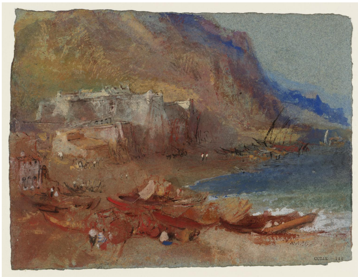
Fig.1 : William Turner, « Riviera » (gouache rehaussée à la plume, sur papier bleu, 14,2 x 19,2cm) (The Priamar Fortress at Savona, c.1828-37 Turner Bequest CCLIX 140, D24705).

Une des plus intéressantes gouaches peintes par Turner sur la Riviera méditerranéenne du royaume de Piémont-Sardaigne (aujourd'hui département français des Alpes Maritimes et province italienne de Ligurie) est celle qui est connue aujourd'hui dans le catalogue de la Tate gallery sous le titre : « Riviera ».