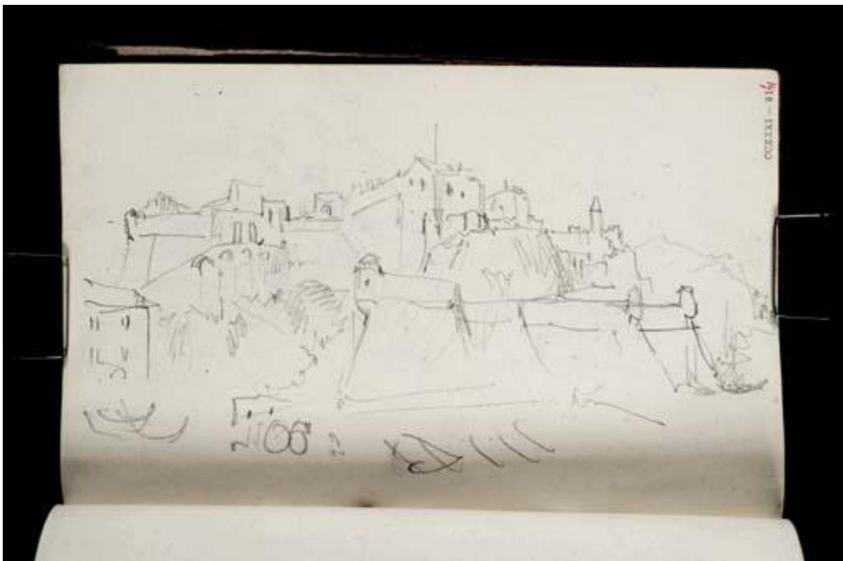
Fig.2 : Castelfranco à Finale Ligure, dessin de William Turner , 179 x 113 mm (carnet CCXXXI 61, D21251, «town on rock », c.1828, Photo ©Tate , CC-BY-NC-ND 3.0)

La forteresse de Castelfranco a retenu notre attention plus longuement, car elle a fait l'objet de plusieurs dessins dans les carnets CCXXXI (D21251) (Fig.2) et CCXXXII (21335). Elle est située sur le territoire de la commune de Finale Ligure, au nord-est de l'agglomération littorale. Mais ses formes défensives, si elles présentent dans la disposition des éléments fortifiés des similitudes avec ceux de la gouache, ne sont pas identiques : en particulier la forme très ramassée du Castelfranco s'oppose à l'amplitude de la forteresse figurée. Elle présente une orientation semblable par rapport au littoral et surtout la porte d'entrée et le pont d'accès ont la même forme que ceux de la gouache; mais son cadre topographique ne correspond pas du tout à ce qu'on voit sur l'œuvre de Turner, et le clocher d'église qui existe à l'arrière-plan droit de Castelfranco (ensemble perchée sur un rocher dominant la mer, mais qui n'existe plus aujourd'hui) n'apparaît nulle part dans l'œuvre étudiée..