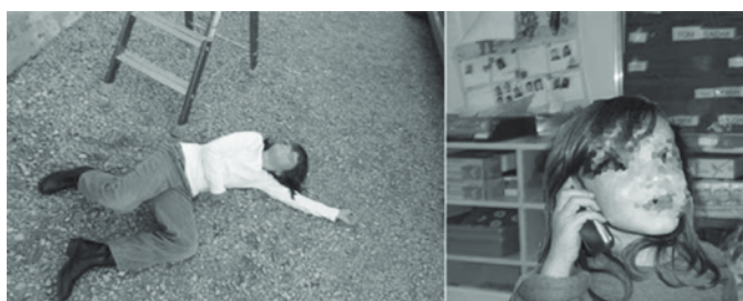
Image 1. Scénette en grande section de maternelle