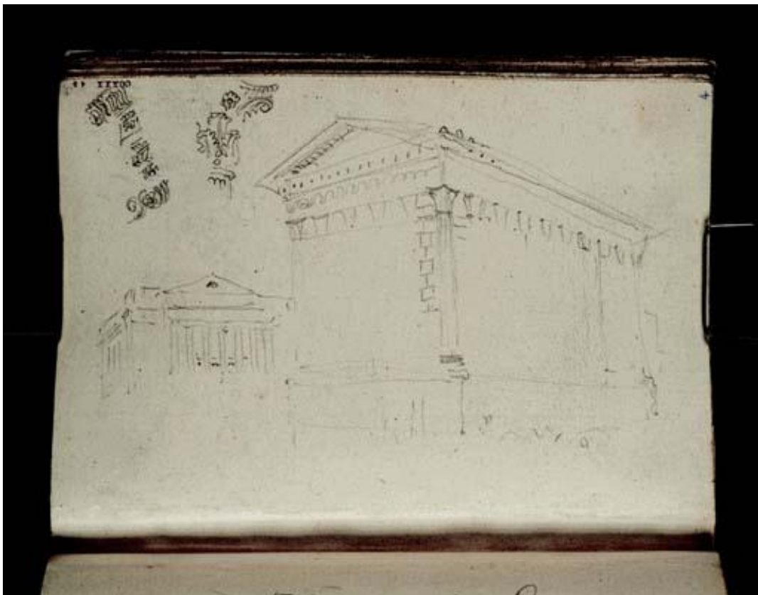
73 La Maison Carrée, Nîmes, 1828, Mine de plomb, 11,1 x 14,5 cm (Extrait d'un carnet de croquis « de Lyon à Marseille » ; TB CCXXX 45 Tate, Londres. Accepé par la nation dans le cadre du legs Turner, 1856 (D21078) http://www.tate.org.uk/art/artworks/turner-roman-ruins-at-nimes-d21078 CC-BY-NC-ND 3.0