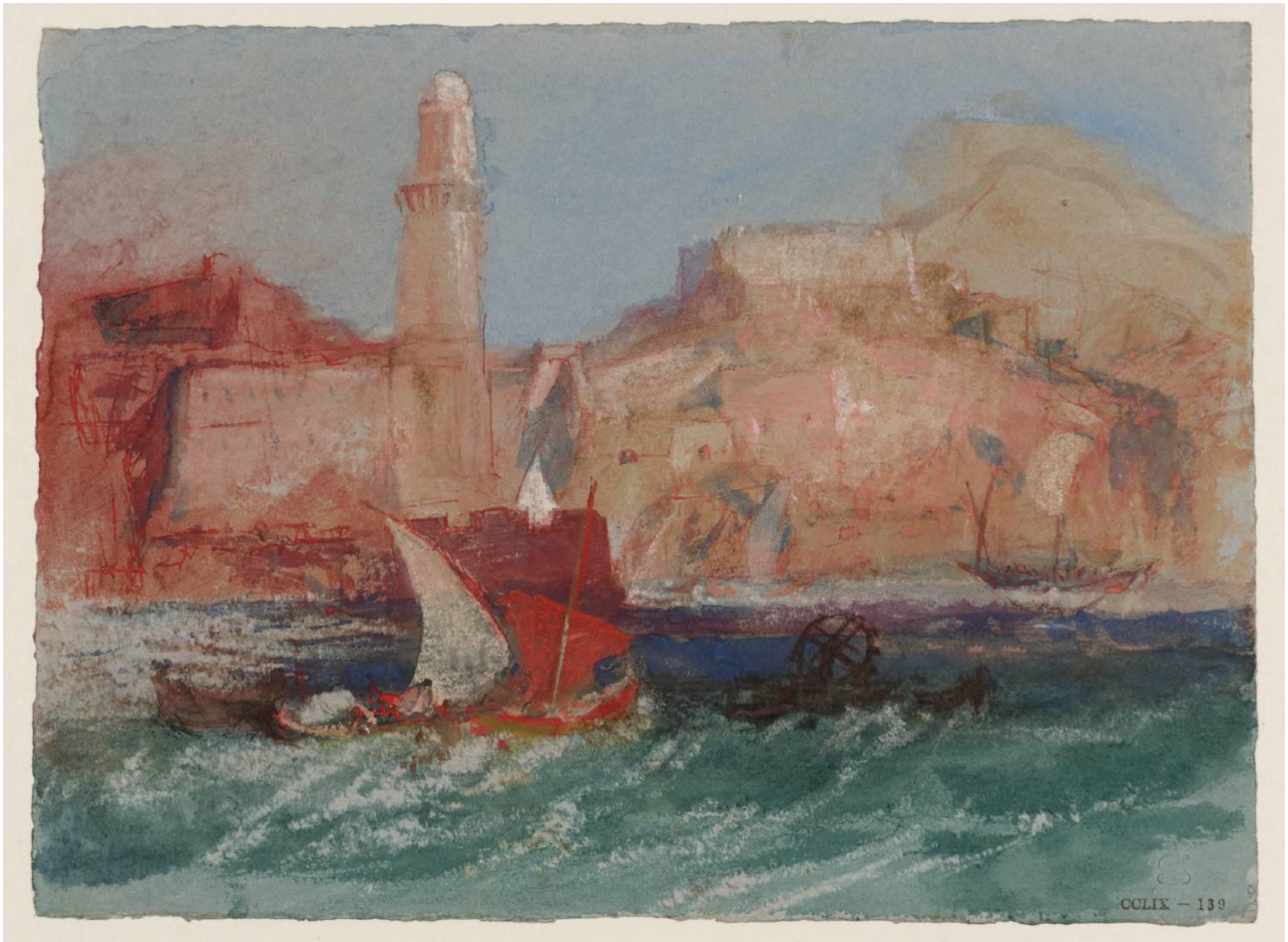
74 Le Phare de Marseille depuis la mer, vers 1838, Aquarelle et gouache sur papier gris, 14,2 x 19 cm Tate, Londres. Accepté par la nation dans le cadre du legs Turner, 1856 (D24704) CC-BY-NC-ND 3.0 http://www.tate.org.uk/art/artworks/turner-the-lighthouse-at-marseilles-from-the-sea-d24704