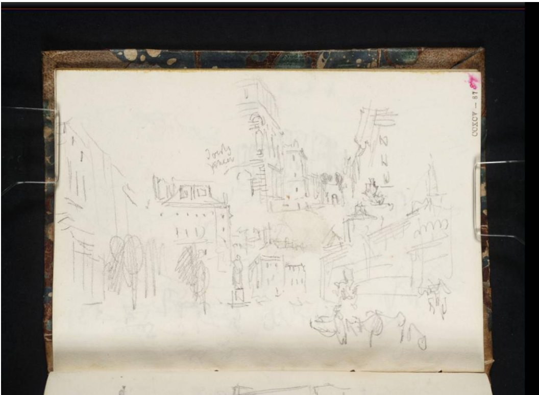
76 Aix-en-Provence, 1838, Mine de plomb, 10,3 x 14,6 cm (Extrait d'un carnet de croquis « de Gènes à Grenoble » ; TB CCXCV 87) Tate, Londres. Accepté par la nation dans le cadre du legs Turner, 1856 (D29548) http://www.tate.org.uk/art/artworks/turner-street-scene-etc-d29548 CC-BY-NC-ND 3.0