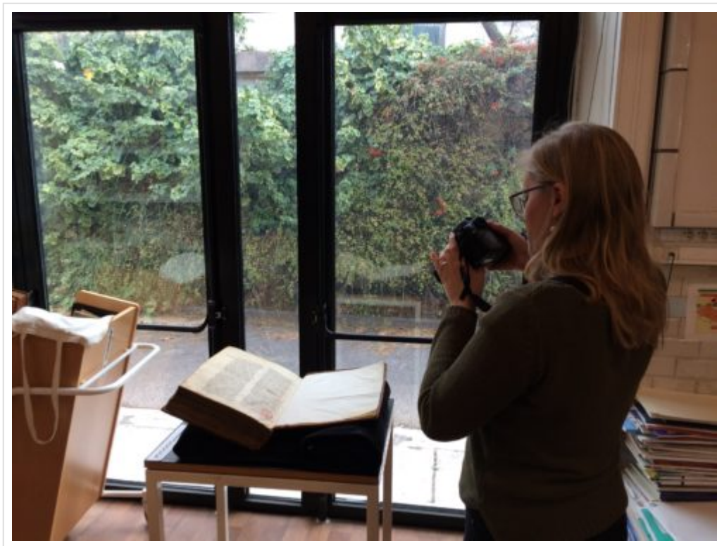
Figure 1 : Prise de vue lors de la numérisation d'un manuscrit de la Bib. Méjanès, novembre 2017.

A l'heure actuelle, 17 modèles 3D ont été réalisés à partir de 10 manuscrits. Ils ont été modélisés en position fermée et en position ouverte (quand cela était possible). 2 manuscrits ont pu être modélisés à la bibliothèque Méjanès d'Aix-en-Provence, dont Ms 1355 (Fig. 3) ; 5 à la Bibliothèque Municipale de Lyon, dont Ms 5 (Fig. 2, 4 et 9), Ms 479 (Fig. 5), Ms 3 et 4 (Fig. 6) et Ms 414 (Fig. 7 et 9) ; MS 1626 à l'Alcazar de Marseille, une bible hébraïque en 3 volume (Fig. 8).