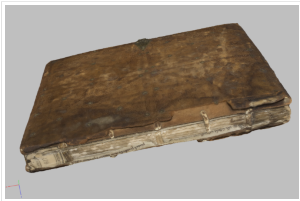
Figure 5 : Capture d'écran du modèle 3D du MS Lyon BM 479, reliure 15e siècle et fragment de manuscrits hébreux (décrits par E. Attia dans la base BWB).