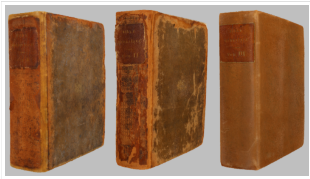
Figure 8 : Captures d'écran des modèles 3D du MS 1626 de la BMVR Alcazar, Marseille.