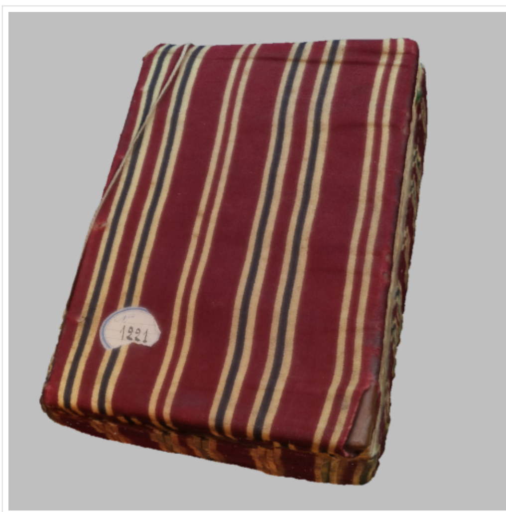
Figure 3 : Capture d'écran du modèle 3D du MS Aix, Méjanes BM, 1355, Psaumes, Cantiques de l'Ancien et Nouveau testament, Cantique des Cantiques, Hymnes (Harar, Ethiopie, 1896).