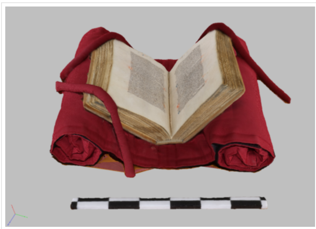
Figure 7 : Capture d'écran du modèle 3D du MS Lyon 414, Latin, Bible d'origine anglaise, environ 1230, associé à R. Grossetste (cf. Saenger 2013, 63).