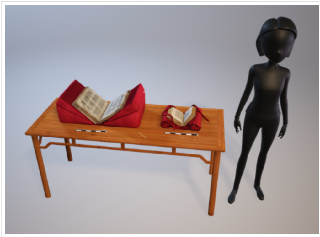
Figure 9 : Mise en perspective sur une table virtuelle des Ms 5 et 414

Les résultats sont, à notre avis, très stimulants et la 3D me semble être un complément intéressant de la 2D : il ne s'agit pas de numériser tout le manuscrit selon cette technique, mais deux ou trois prises. Cela donne à voir des manuscrits ouverts et/ou fermés que rien ne permet de mettre ensemble dans la réalité et aussi de voir leur matérialité de façon innovante par rapport à l'échelle humaine qui est notre prisme de perception sensible.