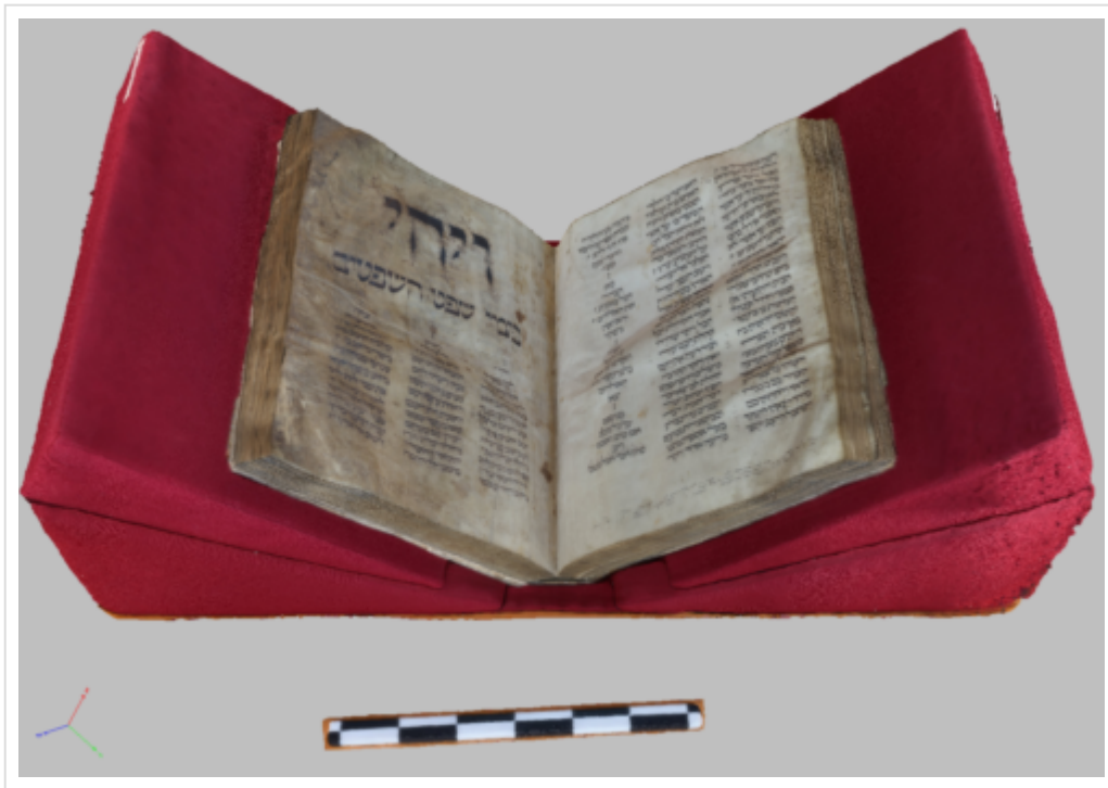
Figure 4 : Capture d'écran du modèle 3D du MS Lyon 5 (Hébreu, Fin XIIIe-Début XIVe siècle), livre ouvert avec mire (31 janvier 2018).