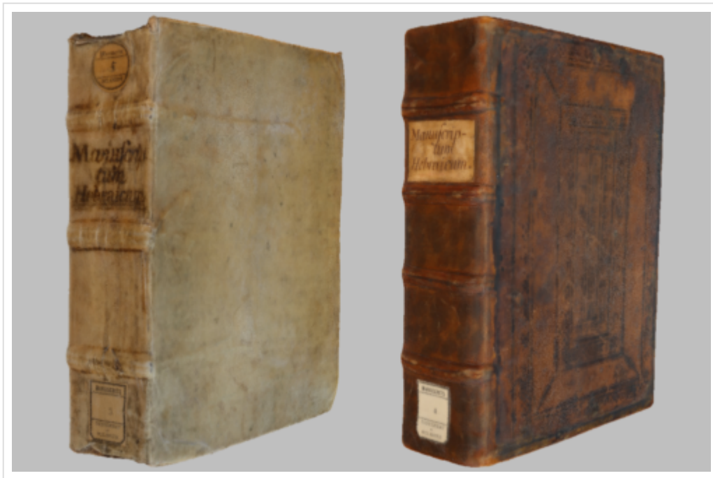
Figure 6 : Captures d'écran des modèles 3D des MS Lyon 3-4, Concordance biblique et massorétique d'Elie Lévitá (voir Articles Attia 2010, Attia 2012 et Attia 2017).