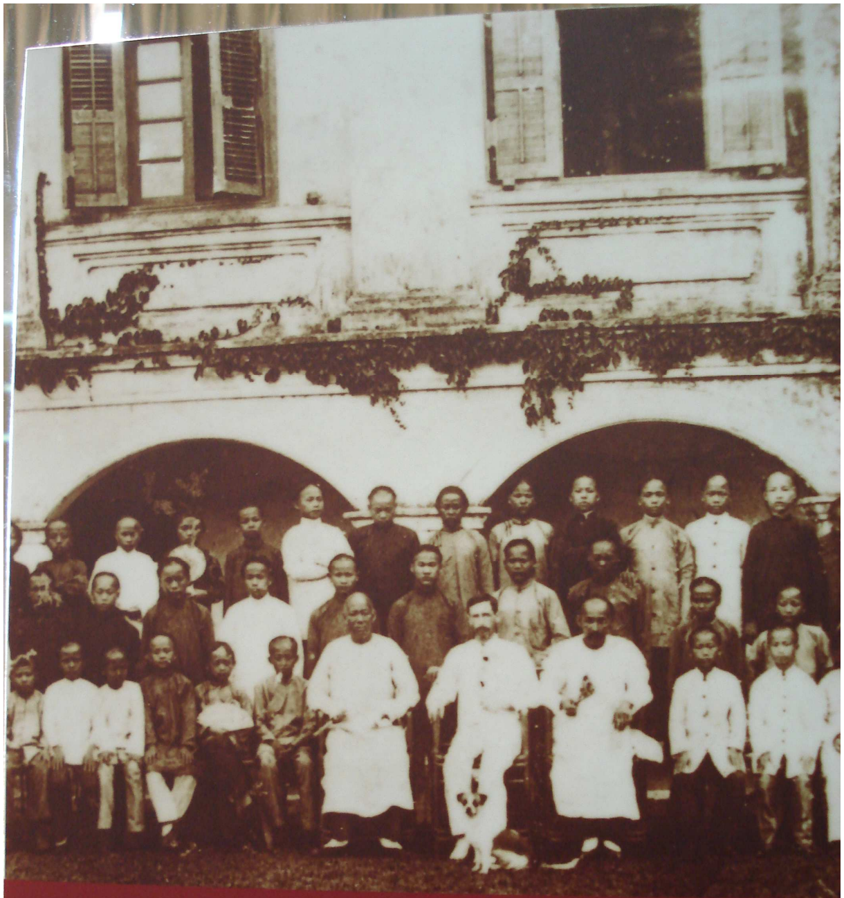
1906年 在新樓上課師生合影

Teachers and all the students at Shin-Lo 1906