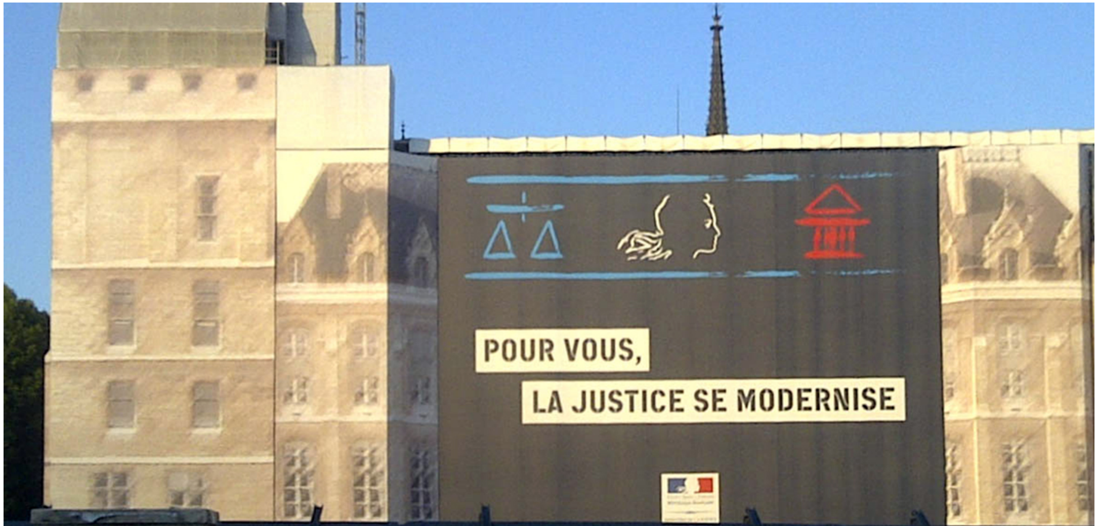
Le Palais de Justice, Paris, 2011.

Il me semble que personne n'est d'accord :