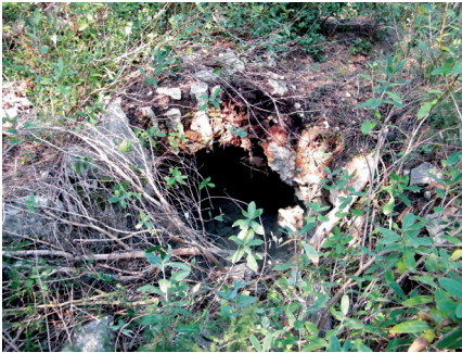
Figure 1. Vestiges actuels non sécurisés de la cheminée rampante de l'usine de soude proche du col de la calanque de Sormiou