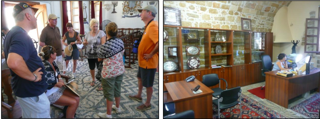
Illustration n°3 La mise en place d'un dispositif de visite à la synagogue Shalom de Rhodes

cette marque 13 : prières expéditives qui rappellent une dévotion routinière assez éloignée du recueillement que les survivants ou les « touristes des racines » manifestent habituellement.