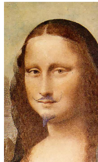
Marcel Duchamp, avec L.H.O.O.Q. (1919), joue, par provocation, sur l'opposition entre masculin et féminin.