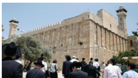
La tomba dei Patriarchi di Hebron

Le manifestazioni interreligiose si fondano su questo repertorio comune, compiendo un passo ulteriore. L'investimento devozionale da parte di persone di religione diversa si concentra su una stessa figura santa, e si attua nello stesso santuario. Il paesaggio del Mediterraneo orientale e meridionale è così punteggiato da centinaia di luoghi di culto segnati, spesso per lunghi periodi, da una sovrapposizione di affiliazioni religiose. Sono quelli che Frederick Hasluck definiva come "santuari ambigui".