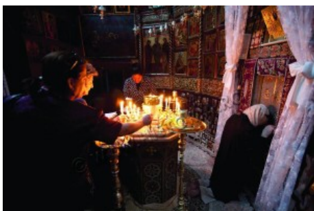
Monastero di Nostra Signora di Saydnaya, Siria