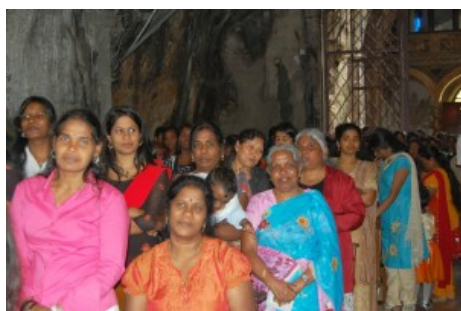
Tamil a Monte Pellegrino presso il santuario di S. Rosalia, Palermo

Accanto a queste manifestazioni devozionali, che vengono essenzialmente "dal basso" e si dispiegano in modo spontaneo e disorganico, confidando nella buona volontà dei gestori del santuario, esistono poi le nuove forme di conversazione interreligiosa, di cui abbiamo parlato all'inizio. Esse sono organizzate per lo più "dall'alto" e si concretizzano nella creazione mirata e attentamente progettata di spazi multiconfessionali, come quello di Berlino. In un caso come nell'altro si tratta di manifestazioni per molti versi ineluttabili in una situazione caratterizzata da un crescente pluralismo religioso.