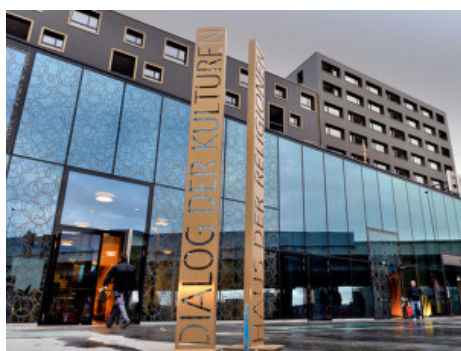
Haus der Religionen, Berna

Molte manifestazioni della stessa natura si sono verificate regolarmente nei secoli successivi. Una grande varietà di fonti – storie di viaggi, agiografie, scritti polemici e, più recentemente, studi di folclore, storia ed etnografia – testimoniano una miriade di scambi religiosi dal medioevo a oggi. Un'esplorazione a lungo termine rivela la durata e la solidità dell'intreccio interreligioso, indicando che la tendenza alla chiusura del monoteismo lascia spazio a forme di porosità quando persone di diverse religioni vivono in stretta prossimità (cfr. Albera 2005a; 2008). Un importante contributo alla comprensione di questi fenomeni viene dalle ricerche pionieristiche effettuate nei primi decenni del XX secolo dallo studioso inglese