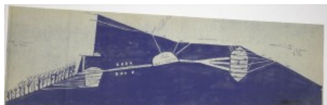
Le Corbusier, Basilique La Sainte Baume, France, 1948

collocano in ambiti diversi: aeroporti, università, ospedali, edifici pubblici, centri commerciali, sedi di organizzazioni internazionali (compresa quella della FIFA a Zurigo). È così nata una serie di nuovi spazi “plurali” che offrono un’infrastruttura “spirituale” nei luoghi di passaggio frequentati da folle variegata, dove s’incrociano i passi di persone con sensibilità religiose differenti. La presenza di luoghi multi-