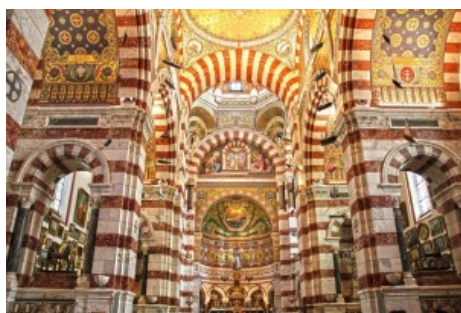
Cattedrale Notre Dame de la Garde, Marsiglia

Insomma, tutto sembra portare a un rafforzamento dei confini religiosi, a un consolidamento delle identità e a una rigorosa sorveglianza delle pratiche devozionali. Eppure anche in queste regioni dove, dall'Algeria ai Balcani al Medio Oriente, i confini religiosi sono stati spesso ridisegnati con il sangue, restano degli spazi per la continuità di forme di convivialità interreligiosa. In questi settori si disegna insomma una fase di transizione, caratterizzata dalla dissoluzione di un vecchio ordine mediterraneo fatto di un mosaico di popoli e culti locali, dove la commistione religiosa aveva spesso diritto