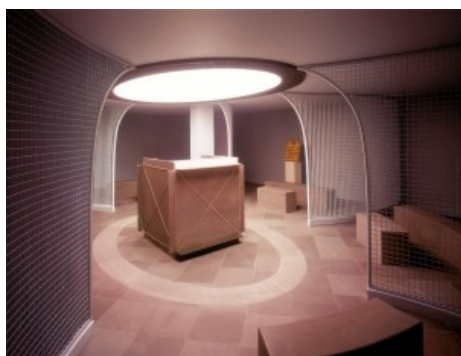
Pistoletto, luogo di raccoglimento multiconfessionale a Marsiglia

Se nel mondo cristiano le minoranze musulmane scompaiono ineluttabilmente e la presenza degli ebrei è drasticamente ridotta, l'evoluzione è diversa nel mondo musulmano. L'Islam condivide col Cristianesimo la tendenza all'espansione territoriale e all'omologazione delle identità religiose. L'elaborazione di una geografia politico-religiosa si è però mossa su binari differenti. Il diritto musulmano ha elaborato una distinzione fra tre categorie di territori: il paese dell'Islam ( Dar al-Islam ), il paese della guerra ( Dar al-Harb ) e il paese del trattato ( Dar al-Sulh ). La prima categoria, che include tutti le regioni governate dai musulmani, è stata a sua volta organizzata in tre ambiti: il territorio sacro ( Haram ), comprendente la Mecca e i suoi dintorni; lo Hedjaz , corrispondente all'omonima regione dell'attuale Arabia Saudita; infine, tutte le altre zone. Mentre la maggior parte delle scuole giuridiche (con l'importante eccezione degli hanafiti) ha vietato l'accesso dei non-musulmani ai primi due territori, la circolazione e la residenza di questi ultimi nel terzo ambito, che rappresentava la stragrande maggioranza dei territori, furono unanimemente accettati. Ai seguaci delle altre religioni monoteiste fu attribuito lo status di protetto ( dhimmi ), che implicava il pagamento di una tassa.