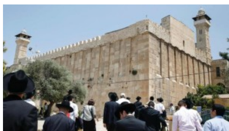
La tomba dei Patriarchi di Hebron