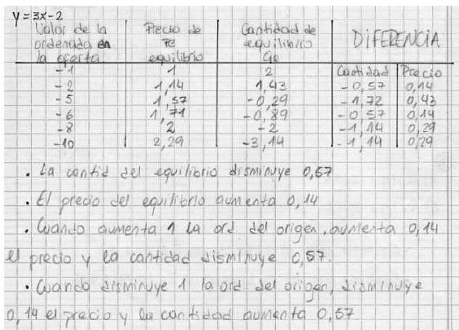
Figure 1. Une étude expérimentale de la variation du point d'équilibre.

Les auteures explicitent le fait que l'introduction de la notion de dérivée à l'aide de celle de limite (œuvre qui pouvait venir s'intégrer dans le milieu pour l'étude puisqu'elle avait été enjeu de l'étude dans une classe antérieure) a suscité un « hors-sujet », qui a conduit à « reconstruire partiellement la praxéologie relative à la limite de fonctions » en réponse à des questions posées par les élèves comme « La limite d'une fonction existe-t-elle toujours ? » ou encore « Combien d'indéterminations trouvons-nous ? Comment peuvent-elles se sauver ? » (Parra et al., 2013, p. 17).