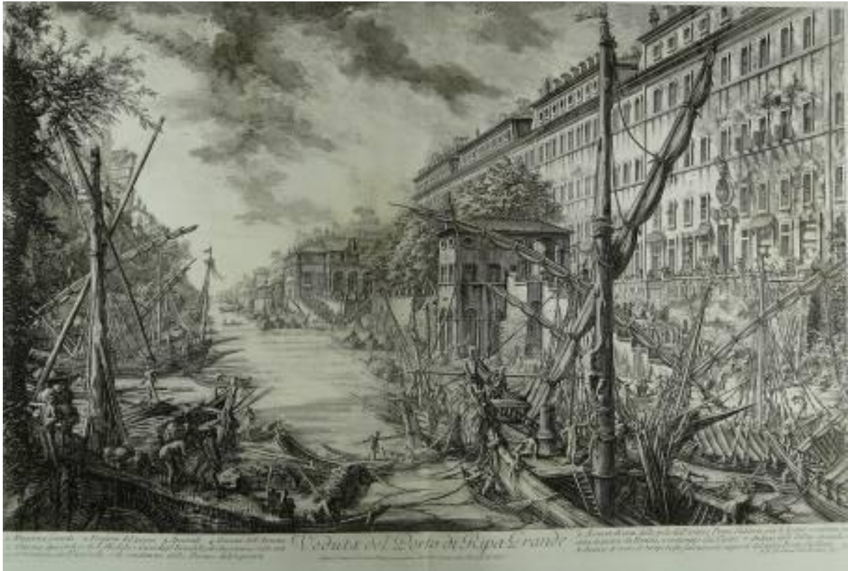
Figure 4: Piranèse, Veduta del Porto di Ripa Grande , , gravure à l’eau forte, in Vedute di Roma , Rome, 1778

nombreuses vues du campo vaccino. Ces œuvres, bien qu’anonymes, étaient de qualité et révélaiient une véritable technique du paysage et de la couleur : elles sont en quelque sorte les ancêtres de nos « cartes postales ».