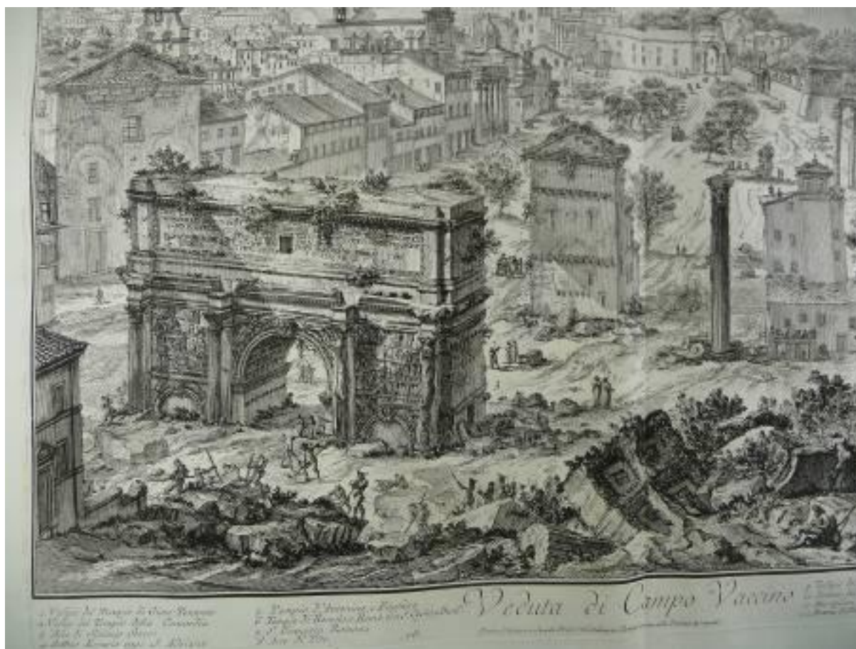
Figure 3 : Piranèse, Veduta di Campo Vaccino , gravure à l'eau forte, in Vedute di Roma , Rome, 1778 (détail)

Sévère en partie enterré par les sédiments, et des personnages bien mis qui admirent les ruines antiques comme devaient le faire nos « touristes » anglais.