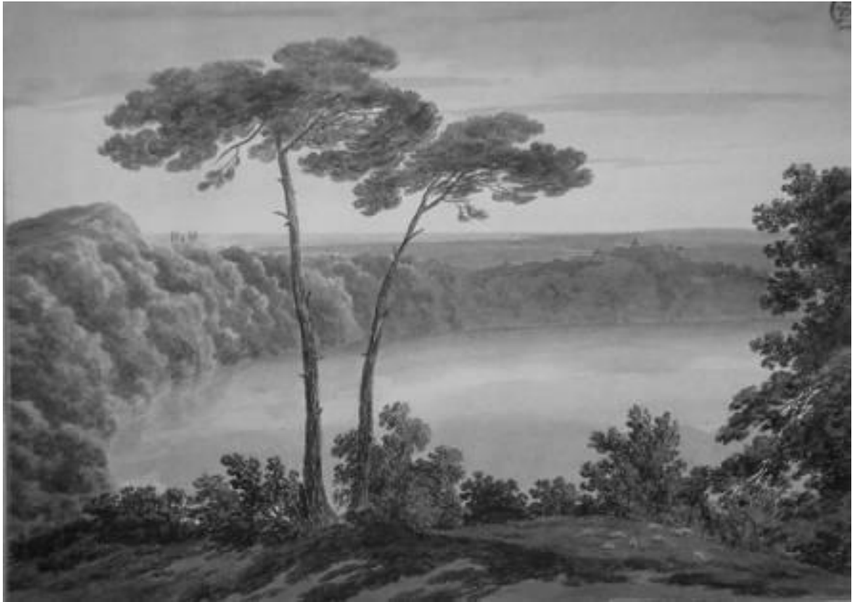
Figure 2 : John Robert Cozens, Lac d'Albano, depuis Palazzuolo , , 1777-78 (crayon et aquarelle, 43,5 x 60,5cm)

Hamilton sur les volcans de la région de Naples 11 figurait dans les bagages de Penn Ashton Curzon (vicomte, membre du Parlement pour le Leicestershire) : ses superbes planches en couleur, coloriées une à une à la gouache et à l'aquarelle par des artisans napolitains dans