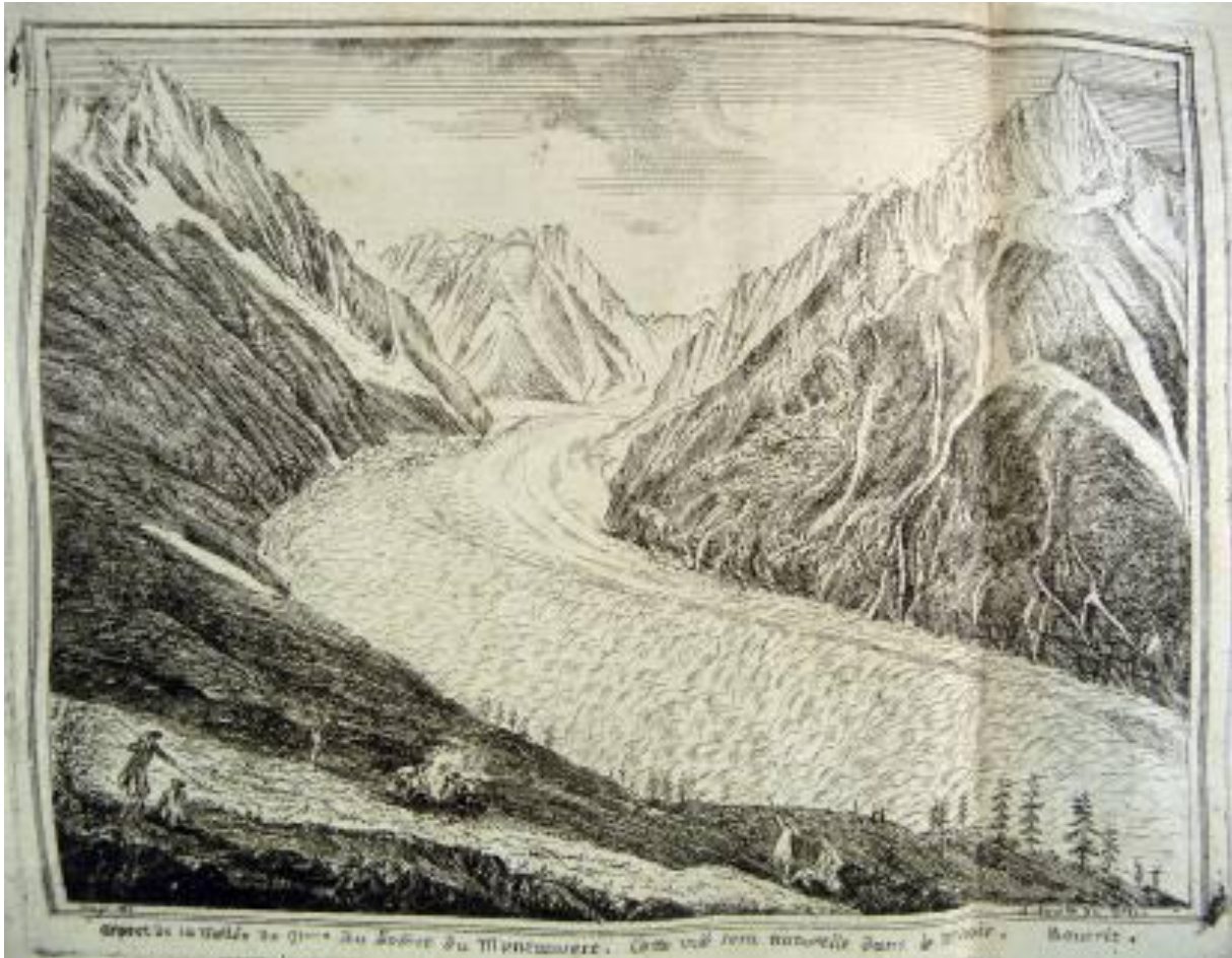
Figure 1 : Aspect de la vallée de glace du sommet du Montanvert. Cette vue sera naturelle dans le Miroir. Bourrit : planche n°2 in « Description des glaciers, glaciers & amas de glace du Duché de Savoye » par Marc Théodore Bourrit, chantre de l'église cathédrale de Genève, Genève, Bonnat, 1773, 136p.