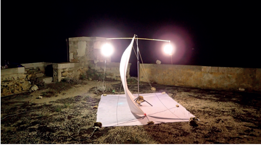
Figure 2. Piège lumineux installé sur le toit de la Batterie du sud de Bagaud, lors de la chasse de nuit du 02-X-2017 © P. Ponel.

Durant la période de chasse (de 19:30 à minuit, heure locale), les conditions météo présentait un vent d'environ 10 km/h (6 nœuds) et une température de l'air de 20 °C ( www.windguru.cz ).