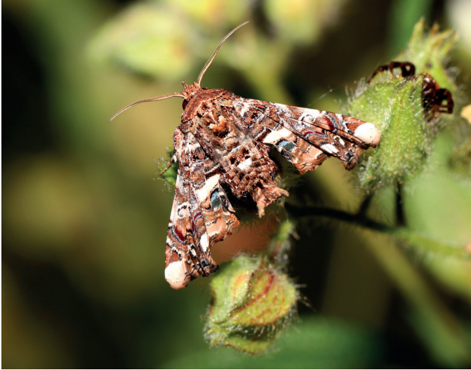
Figure 3. Eutelia adulatrix (Hübner, 1813), une Noctuelle méridionale qui se développe probablement sur le lentisque Pistacia lentiscus L. à Bagaud, photographiée au Cap Lardier (La Croix-Valmer, Var) le 11-V-2018 © M. Fouchard.

Certaines espèces paraissent liées à un petit nombre de plantes hôtes qui ont toutes été déjà détectées sur l'île (Krebs et al. , 2014). C'est le cas de Loxostege sticticalis qui vit notamment sur Artemisia arborescens et Chenopodium album , ou bien de Chilodes maritimus qui est associé à Phragmites australis récemment inventorié à l'est de Bagaud (données non publiées). D'autres espèces sont associées à des plantes très abondantes sur Bagaud, comme Catarhoe basochesiata dont la chenille vit sur Rubia peregrina , ou Eutelia adulatrix qui vit entre autres plantes sur Pistacia lentiscus . Menophra abruptaria est citée dans la littérature ou les sites internet sur troène, prunier et lilas ; aucune de ces essences n'étant présente sur l'île, il est fort probable que cet éclectisme recouvre en fait une réelle polyphagie chez la chenille : le troène ( Ligustrum ) étant une Oléacée il est possible que les filaires ( Phillyrea angustifolia ) très abondants sur Bagaud puissent convenir à cette espèce comme plante hôte. Toutes les espèces de Lépidoptères inventoriées sur l'île ont donc certainement une origine locale et n'ont pas été attirées depuis l'île de Port-Cros par notre piège lumineux, même si cette possibilité ne peut être entièrement écartée puisque le Cap Sud de Bagaud se trouve à moins de 500 m de la pointe de la Malalongue, à l'ouest de Port-Cros.