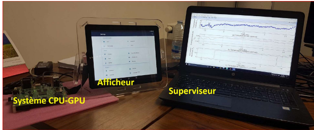
FIGURE 2 – La maquette d'expérimentations et validation.

Les modèles construits dans le paragraphe précédent sont implémentés sur un ordinateur superviseur. Ce dernier permet de générer des estimations en parallèle et en lignes (Figure 2).