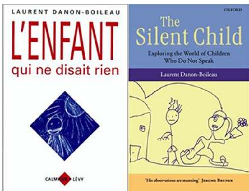
Couverture de L'enfant qui ne disait rien Couverture de The Silent Child. Exploring the World of Children Who Do Not Speak

©Calmann-Levy, 1997 / ©Oxford University Press, 2007