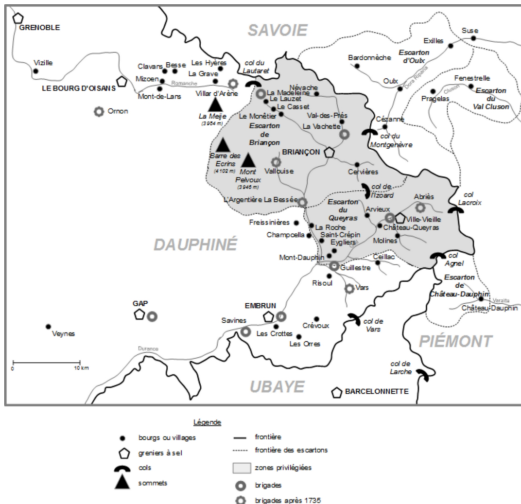
Carte 2. Le Briançonnais après Utrecht (1713) (carte réalisée par Hubert Proal)

L'acte du 11 avril 1713, qui fonde les limites entre France et Piémont sur le principe des eaux pendantes, du Mont Thabor jusqu'au col Agnel, prive la France des escartons d'Oulx, de Valcluson et de Château-Dauphin (carte 1). Trois éléments essentiels ressortent des écrits des contemporains et d'un certain nombre d'historiens qui présentent ce traité comme un désastre sur le plan économique pour le Briançonnais et l'ensemble du Haut-Dauphiné: la perte des territoires les plus riches du Grand Escarton; le déclin irrémédiable, jusqu'au Second Empire, de la route du Montgenèvre, transformée en impasse; la ruine consécutive de Briançon, qui avait fondé une partie de sa prospérité, depuis le Moyen Âge, sur ses foires et qui devenait tout à coup un cul-de-sac. 4