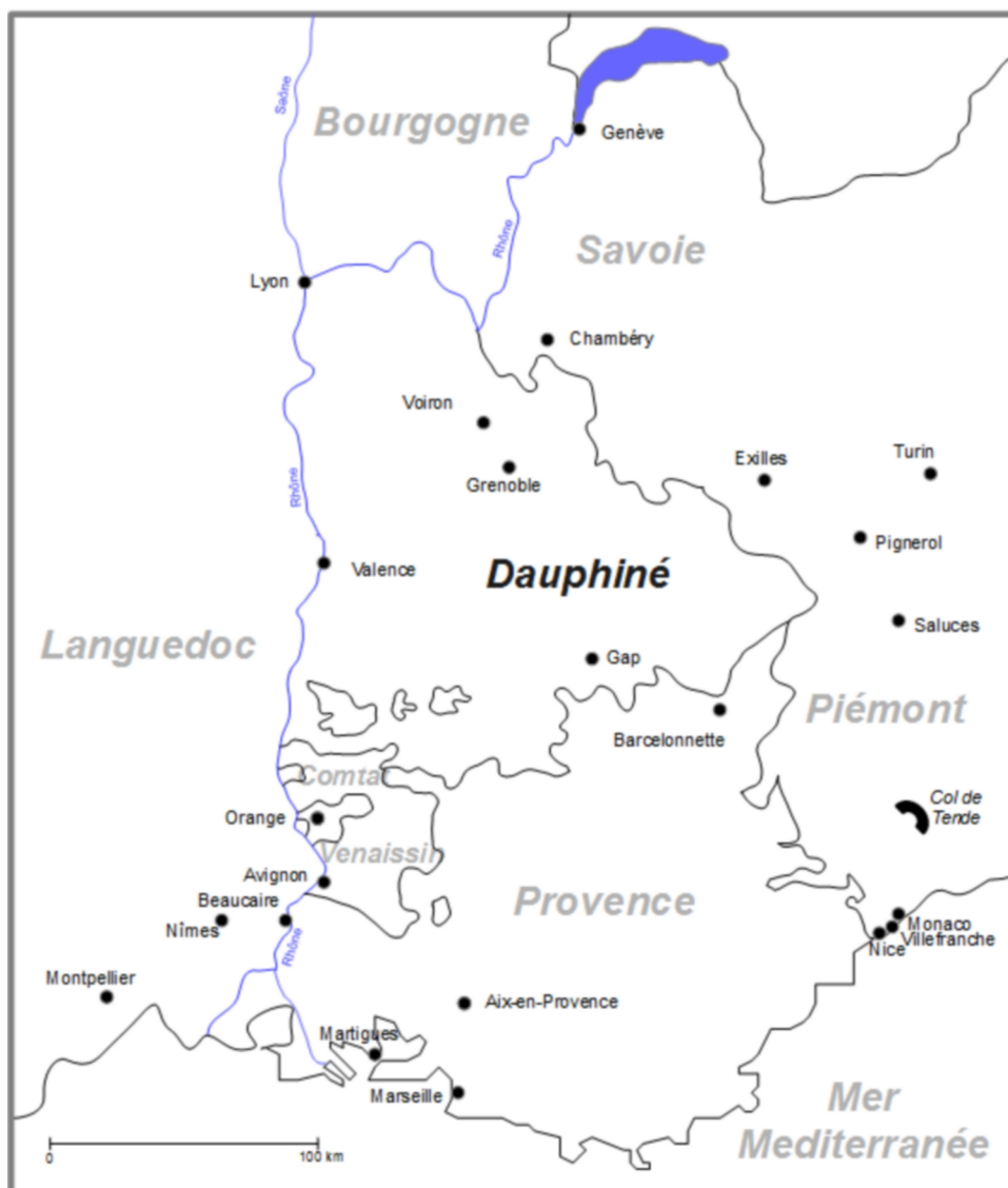
Carte 1. Le Dauphiné et ses voisins au XVIII e siècle (carte réalisée par Hubert Proal)

La contrebande y est endémique et se pratique à tous les niveaux, relevant aussi bien de la simple stratégie de survie que de la guerre commerciale entre États. Par là, cette aire marchande internationale constitue un laboratoire idéal pour appréhender à la fois les ressources spécifiques offertes par la frontière, les dynamiques sociales, économiques et politiques qui s’y jouent et l’attitude de l’État ou des pouvoirs locaux face aux trafics. Surinvestie par l’État, la zone transfrontalière étudiée est loin de constituer un espace de non droit peuplé d’habitants rebelles. À l’opposé d’une vision romantique de la contrebande et d’une approche strictement criminologique de la frontière, cette étude se veut aussi une réflexion sur le pouvoir et la capacité d’action des individus ou des communautés. La démarche parie sur la fécondité attendue d’un emboîtement des échelles d’observation et sur la prise en compte des différents horizons, proches ou lointains, des acteurs de l’économie, qu’ils se situent ou non à proximité de la frontière. La première partie de ce travail interroge la dialectique entre frontière imposée et frontière vécue, en examinant les conséquences du traité d’Utrecht (1713) sur le Haut-Dauphiné. La deuxième partie de l’article est consacrée plus précisément à la question du contrôle de la frontière, à travers cette fois l’exemple de la lutte menée, dans les