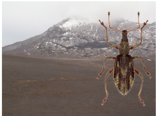
Figure 2. - Le "fell-field", à l'île de la Possession (archipel Crozet) et Xanimum vanhoeffenianum (taille : 5 mm). (Clichés ©S. Gutjahr & ©P. Ponel).