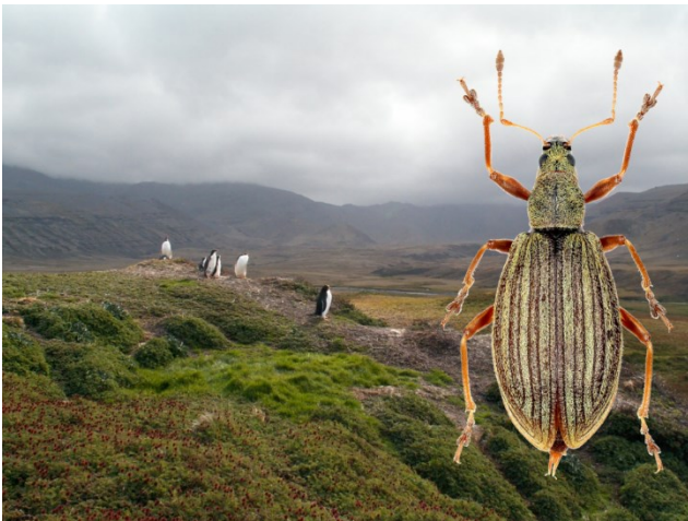
Figure 1. - Vue de la Vallée des Branloires (île de la Possession, archipel Crozet) avec au premier plan des tapis d' Acaena magellanica et de Poacées et Dusmoecetes richtersi (taille : 8 mm). On y voit également des Manchots papous Pygoscelis papua .

Remerciements. - Nous remercions Sylvain Gutjahr qui a réalisé les clichés des habitats.