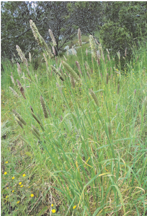
Fig. 5. – Phalaris sp., végétal sur lequel se trouvait Oulema duftschmidi (île de Porto Santo).

Oulema duftschmidi (Redtenbacher, 1874). – Nous avons relevé cette espèce le 4.IV.2015 sur l'île de Porto Santo (JDCV). Deux spécimens ont été trouvés au nord du Pico Castelo dans une zone forestière (environ 300 m) et neuf spécimens au sud du Pico do Facho (environ 450 m). Tous les spécimens ont été récoltés par fauchage de Phalaris sp. (fig. 5).