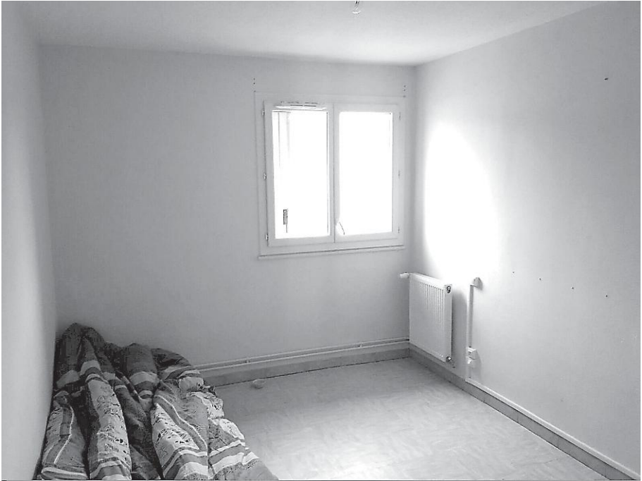
Figure 4. Une chambre dans le logement vide à Narbonne (2017)

voient pourtant dans l'obligation de partir pour Narbonne en janvier 2017, où ils sont installés dans un appartement dénué de tout équipement (figure 4).