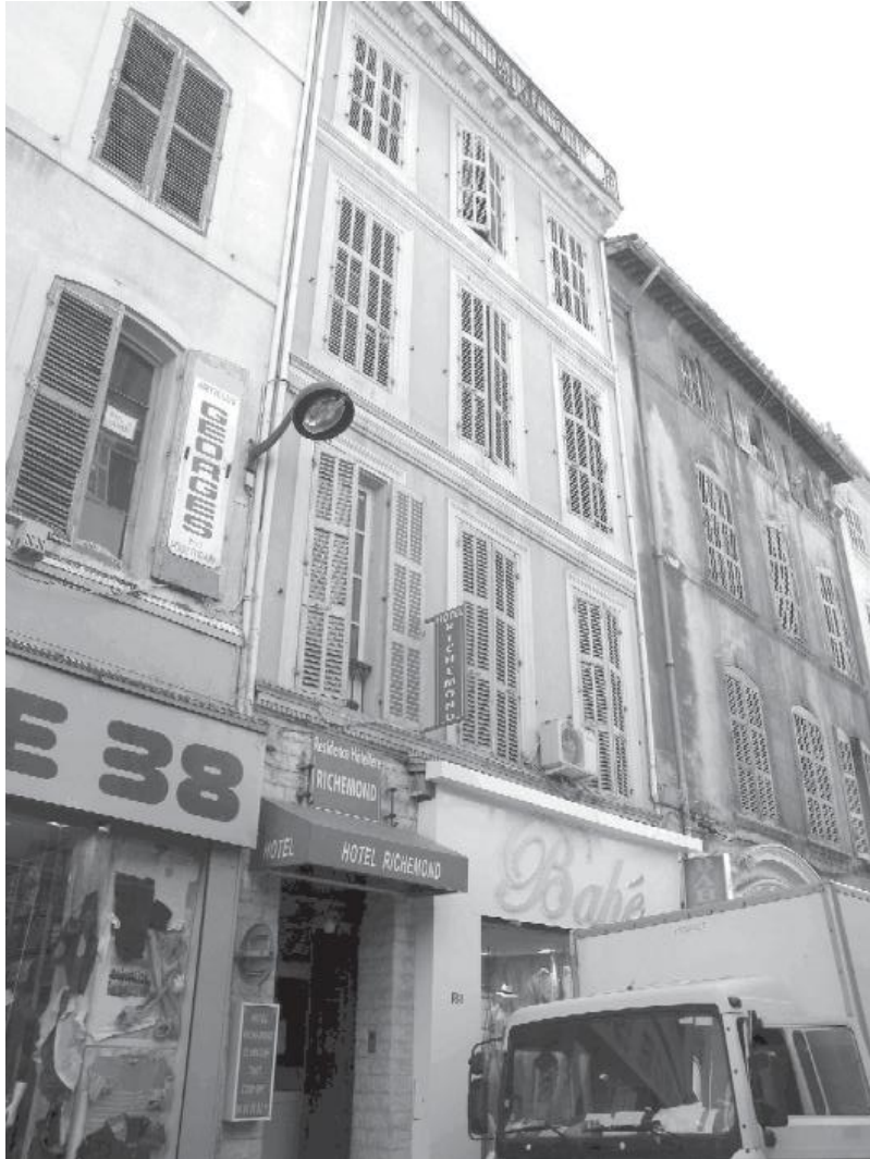
Figure 3. Hôtel meublé, quartier Belsunce (2015)