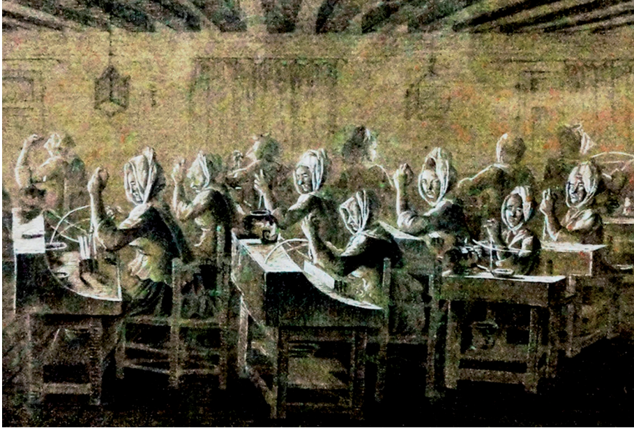
Ill.2 : La manufacture du corail Miraillet, Rémuzat et Cie 65

La valeur du corail, le nombre croissant d'armements marseillais pour la traite négrière et l'absence de concurrence dans la production française incitent les entrepreneurs marseillais à se tourner vers ce marché en sollicitant les ressources halieutiques provençales et africaines 66 . Au reste, pour protéger leurs opérations ils demandent qu'un droit de 20 % soit imposé sur les coraux ouvrés à l'étranger, notamment à Livourne. Le Contrôleur général des finances qui examine la requête interroge l'intendant de Provence pour savoir si les productions de la manufacture marseillaise « peuvent remplacer entièrement celles de l'étranger, et suffire pour compléter les assortiments nécessaires au commerce de l'Inde et de la Guinée 67 » auquel se livrent, en nombre croissant, des négociants de la place.