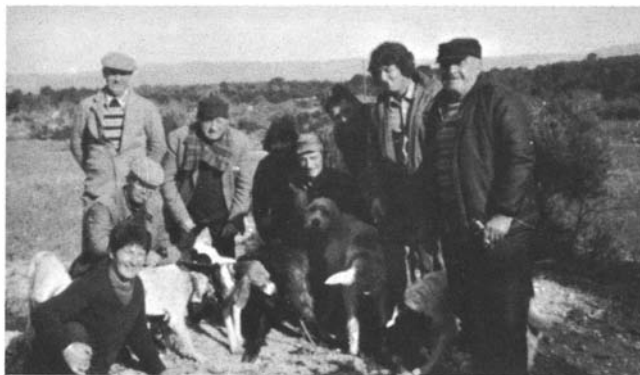
Photo 11. – Postiers et rabatteurs autour du « cochon » blessé.

fait, parmi d'autres, est significatif de la nature des enjeux symboliques que recouvrent l'usage et la maîtrise de l'espace sauvage. Notons, en outre – et ce phénomène est tout aussi significatif – que c'est face aux problèmes de maîtrise de la colline que les communautés rurales ont, par le biais des sociétés de chasse, défini explicitement les divers degrés d'étrangeté.