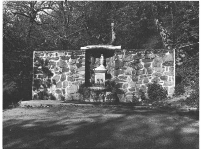
Photos 18 et 19. – Chapelles limitrophes... A la frontière de Cuers et de Solliès, en plein bois, se dressent deux chapelles Sainte Christine, bâties à 50 cm l'une de l'autre.