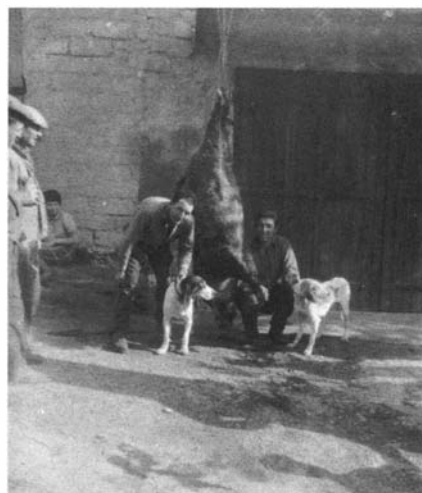
Photo 12. – Le « cochon » est suspendu pour être découpé.

Le partage du sanglier mérite quelques commentaires (photos 11 et 12) ; promené à travers le village, non sans ostentation, le « cochon » est acheminé dans la cour de la maison d'un