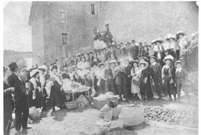
Photo 16. – Tenir embrassé le gros ormeau de St Joseph de la Pérusse (Alpes de Haute-Provence).