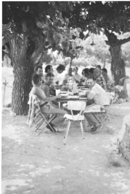
Photos 20 et 21. – « Ribotes » : de nos jours à Cotignac, vers 1930 à Salernes.

réunissaient chacune dans un cabanon une bande d'une dizaine de « collègues » appartenant à la même classe d'âge. On « faisait riboto » à l'occasion de carnaval : c'est au cabanon que l'on se retrouvait pour festoyer, dormir et préparer les déguisements ; au Beausset, des jeunes gens partaient aussi faire « bombance » pendant deux ou trois jours lors des fêtes de Noël. Plus généralement, c'est dans l'espace éloigné du cabanon que l'on conviait ses amis pour enterrer sa vie de garçon, que l'on faisait ripaille à l'occasion du départ d'une classe de conscrits ou pour inaugurer une saison de chasse.