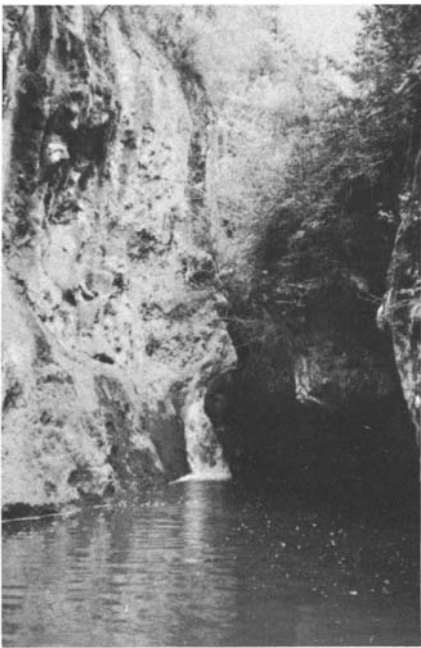
Photos 13 et 14. – Le site de Saint-Barthélémy (à Salernes). La source, le bois, la chapelle.

L'eau... Plus de la moitié des chapelles sont à proximité de ruisseaux ou de sources (photos 13 et 14). La légende attribue souvent au saint tutélaire le jaillissement de celles-ci, au sein de « sauvage solitudes » : la source de la Sainte Baume est, selon la tradition, née des larmes de Marie-Madeleine; celle de Cotignac est due, selon la légende, aux bienfaits de St Joseph ayant pris en pitié un malheureux berger, Gaspard, terrassé par la soif sur les pentes arides du Bessillon.