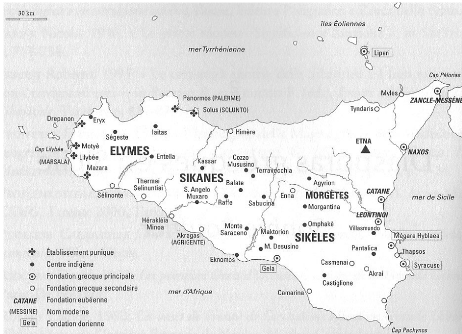
Fig.1. La Sicile (d'après S. Bouffier (dir.), Les diasporas grecques. Du détroit de Gibraltar à l'Indus [VIII e av. J.-C. à la fin du III e s. av. J.-C.] , carte 3, p. 54)

L'une des questions qu'on se pose également lorsqu'on évoque une cité dite coloniale, c'est sa différence ou son analogie par rapport aux sociétés métropolitaines. Tarente, fille de Sparte, ou Syracuse, fille de Corinthe, offraient-elles des modèles sociaux analogues à leurs métropoles ? Ou le phénomène migratoire a-t-il façonné les statuts familiaux et les schémas parentaux au point de proposer un modèle original ? Les sociétés coloniales ont-elles leur spécificité propre par rapport au cas d'Athènes par exemple que l'on a toujours tendance à poser comme un modèle ? Et peut-on répondre à la question à partir de la documentation disponible ?