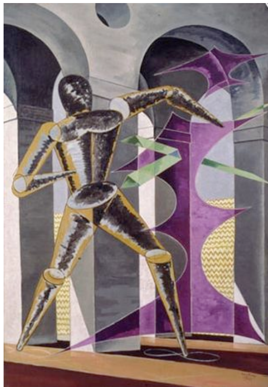
Man Ray, L'Homme infini , 1942 Huile sur toile, 180 x 125 cm, collection privée

Giorgio De Chirico 57 : ses forums antiquisants, ses “mannequins de couturier”. L’homme dont il est question a, en effet, toutes les apparences d’un pantin anonyme. Le procédé se retrouvera tel quel dans d’autres toiles de la même époque : La Jumelle en 1939, End Game en 1942.