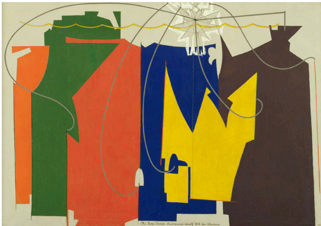
Man Ray, La Danseuse de cordes s'accompagne de ses ombres , 1916 Huile sur toile, 132 x 186 cm, MoMa, New York

En haut de la toile, le sommet du crâne effleurant le segment supérieur du cadre, ladite danseuse, un peu sur la droite de la médiatrice imaginaire, quelque part entre le “multi-images” d’une surimpression chronophotographique et l’épure formelle de L’Homme de Vitruve de Léonard. Une certaine idée de mouvement y est ainsi directement associée, non seulement par l’effet de superposition des différentes étapes d’un même geste en une seule image, mais également par son contexte immédiat : à mi-hauteur, une ligne jaune, ondoyante et régulière, traverse l’espace fictionnel horizontalement, et semble dessiner comme un galbe de vagues maintenant le corps de la femme à flots, comme un bouchon fluctuant, en suspension . De fait, et sous ces deux modalités — surimpression et suspension —, ce “mouvement” est-il encore, à bien des égards, typiquement pictural : du mouvement sur place .