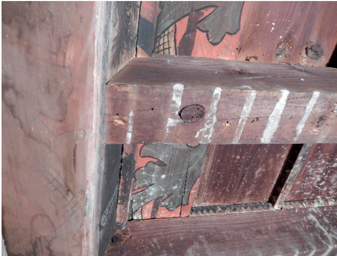
Fig. 5 : Cheville de blocage des ligatures des radeaux par lesquels les billes employées à la confection des solives du plafond peint de la Maison du Patrimoine (Lagrasse, Aude) ont été acheminées (cliché F. Guibal).

sensiblement différent. À leur début, aucune chronologie régionale ayant fonction de référence sur les derniers siècles n'étant disponible, les premières tentatives de datation recoururent aux référentiels développés dans d'autres régions qui, bien évidemment, ne furent d'aucune utilité car non représentatifs des régions dans lesquelles les arbres s'étaient développés. La construction de référentiels locaux, propres à la région méditerranéenne, fut donc amorcée.