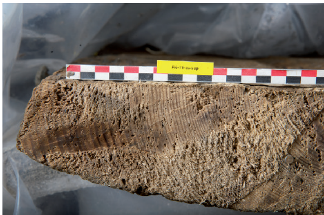
Fig. 3 : Section transversale d'un bois gorgé d'eau (sapin) rafraîchi à la lame de rasoir provenant de l'épave romaine Arles-Rhône 3.