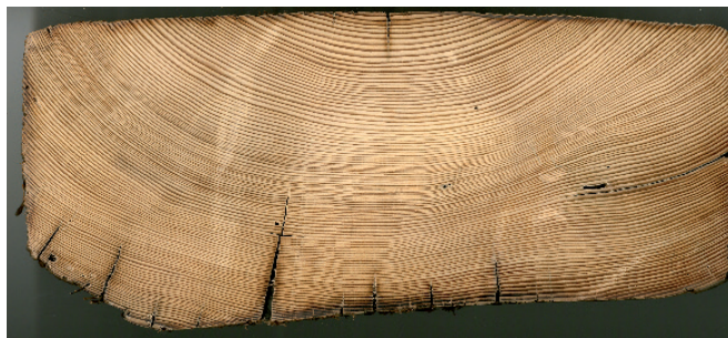
Fig. 2 : Section transversale d'un bois sec (sapin) traitée par ponçage provenant d'un plafond de la Maison du Jeu de Paume à Marseille.

Les référentiels dendrochronologiques permettant de remonter jusqu'à la période romaine furent mis au point en Allemagne au début des années quatre-vingt et ont, pour cela, tiré profit de l'arrivée, dans les années soixante-dix, des appareils de mesure semi-automatiques (fig. 1). Le premier référentiel fut construit en 1980 par Hollstein à l'issue de travaux menés dans le sud-ouest de l'ancienne Allemagne de l'ouest et dans les pays limitrophes. Le deuxième a été assemblé par B. Becker en 1981 et concerne plus particulièrement l'Allemagne du sud. Les données élaborées dans les différents laboratoires allemands furent centralisées au laboratoire de Stuttgart-Hohenheim où Becker, élève de Huber, a travaillé à synchroniser les différents référentiels régionaux tout en alimentant le laboratoire de radiocarbone californien de La Jolla en échantillons d'âge connu afin d'établir la courbe de calibration du radiocarbone (Suess, Becker 1979). Dès le début des années 1970, furent intégrées aux référentiels allemands des données issues de vieux troncs de chêne subfossiles trouvés hors contexte archéologique, conservés dans les sédiments des terrasses