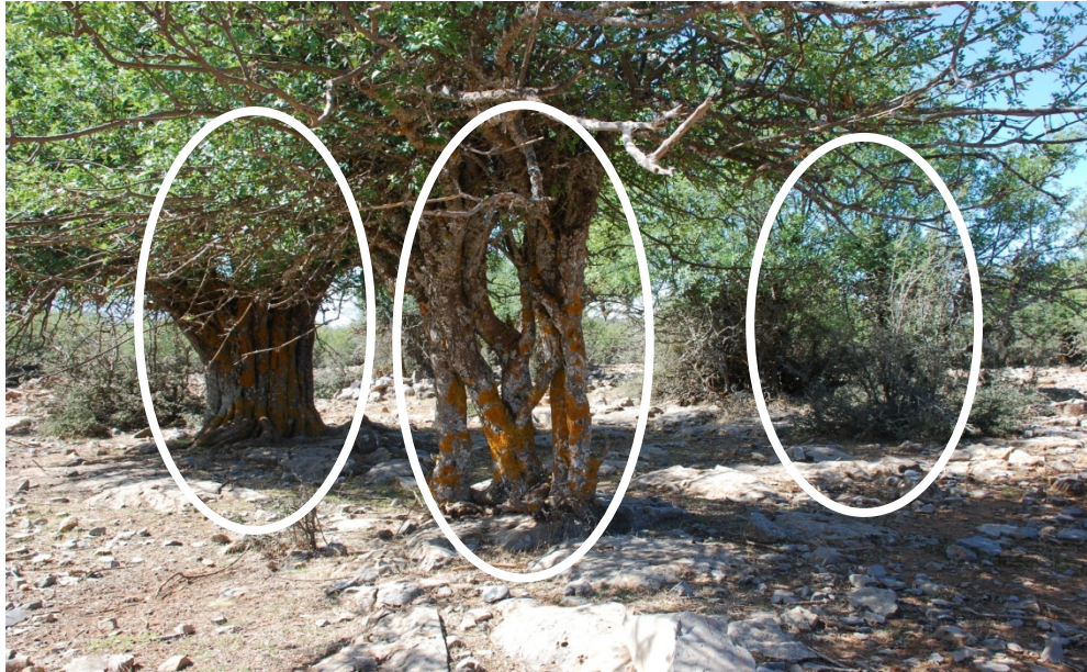
Figure 3 : Trois types physiologiques de frêne dimorphe. (De gauche à droite : tronc anastomosé, forme en taillis multicaule, forme buissonnante)