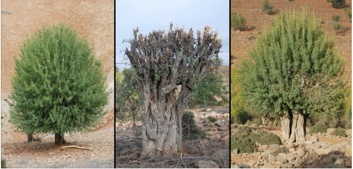
Figure 1 : Exploitation en trogne du frêne dimorphe avec coupe tous les 4 ans pour la fourniture de fourrage foliaire