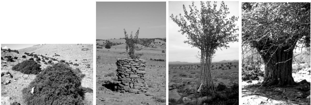
Figure 4 : Séquence de protection d'un frêne surpâturé (« tahnoucht »), de sélection de tiges pour former un tronc anastomosé