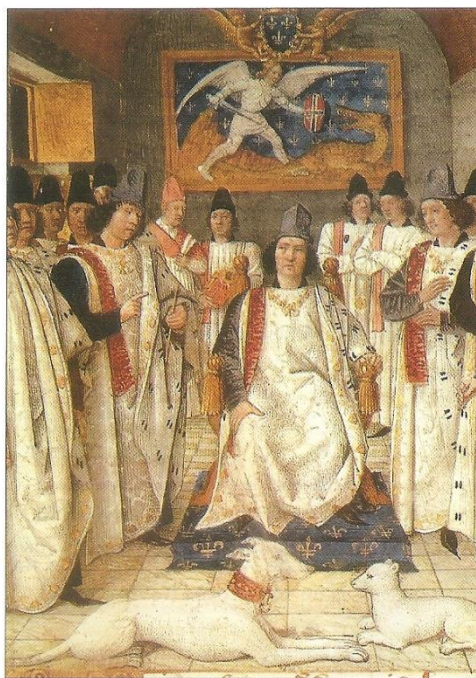
▲ 5. Le roi Louis XI. Musée du Louvre, Paris.