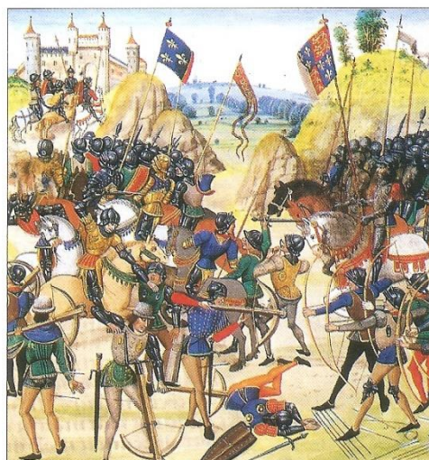
▲ 4. La bataille de Crécy, 1346. Chroniques de Froissart, Bibliothèque Nationale, Paris.

Bouvines : à cette bataille, en 1214, Philippe Auguste battit le roi d'Angleterre Jean sans Terre et ses alliés, le comte de Flandre et l'empereur d'Allemagne.