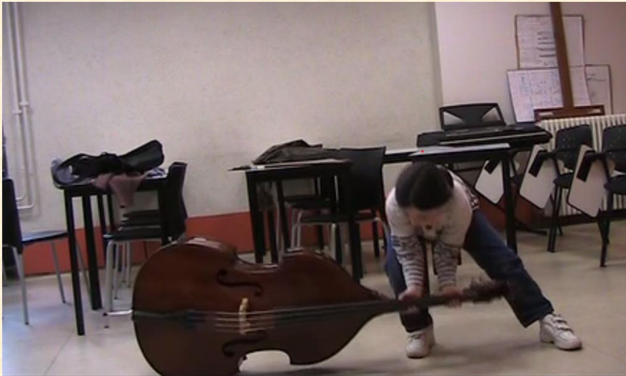
La petite fille à la contrebasse