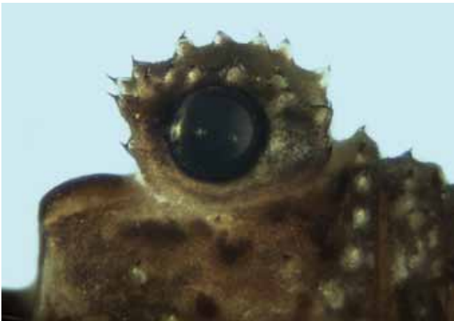
Figure 3.- Kalliste pavonum : vue de profil de l'ocularium du mâle adulte.

Un second critère est l'ocularium assez imposant (fig. 3), représentant plus de la moitié de la longueur du prosoma.