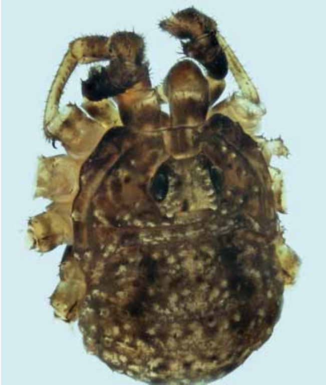
Figure 2.- Kalliste pavonum : vue rapprochée de habitus du mâle adulte, sans patte.

les femelles) qui fait de Kalliste pavonum le plus petit Phalangiidae connu à ce jour (MARTENS, 2018). Ce qui explique aussi, peut-être, la tardive découverte de cette espèce qui a pu être confondue avec des juvéniles.