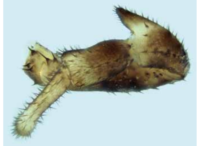
Figure 4.- Kalliste pavonum : vue dorsale du pédipale du mâle adulte.

À noter également la présence d'apophyses prolatérales sur la patella et le tibia, tant chez le mâle (fig. 4) que chez la femelle, et également sur le fémur (uniquement chez la femelle).