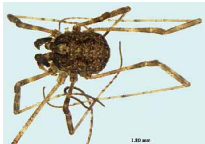
Figure 1.- Kalliste pavonum : habitus du mâle adulte.

L'un des premiers critères est la très faible taille (1,8 à 2,0 mm chez les mâles (fig. 1 et 2) et 1,9 à 2,6 mm chez