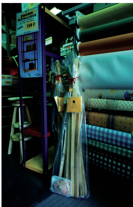
Fig. 3. Katrin Gattinger, La Maison-refuge (promotion du kit) , chez «Bricorama», le kit (tasseaux de bois, vis, crépine de porc, manuel, bâche plastique), Marseille, 1995.

Or, dans la cas de la Maison-refuge , l'artiste spécifie que la vente n'est pas la visée du travail et qu'il s'agit d'un camouflage de l'art dans un monde qui n'est pas celui de l'art. Elle fait « comme si ». Là encore, s'en suit une longue réflexion critique sur les démarches d'authentification d'un travail, allant de la signature à l'image de marque (MERZ, IKB, Société anonyme, Département des aigles, Factory etc.) et les exemples plus contemporains qu'elle décide de traiter : Ingold Airlines, Oklahoma SRL, entreprises fictives toutes deux enregistrées au registre du commerce, proposent sous forme hyperréaliste une parodie grinçante des systèmes économiques. La Maison-refuge ne cherche pas cette analogie avec le monde du commerce comme un but en soi, elle cherche à extraire des promesses symboliques pour les ramener à la réalité. L'acheteur doit « bricoler » sa maison-refuge en dépassant ainsi le stade du regardeur, le bricoleur peut se prendre pour un artiste dans une logique commerciale encouragée par les magasins de bricolage (Fig.3). Ce travail et cette réflexion sont évidemment directement liés à la question des médias et du marketing, au fameux manque créé chez le client pour l'inciter à acheter le produit 10 .