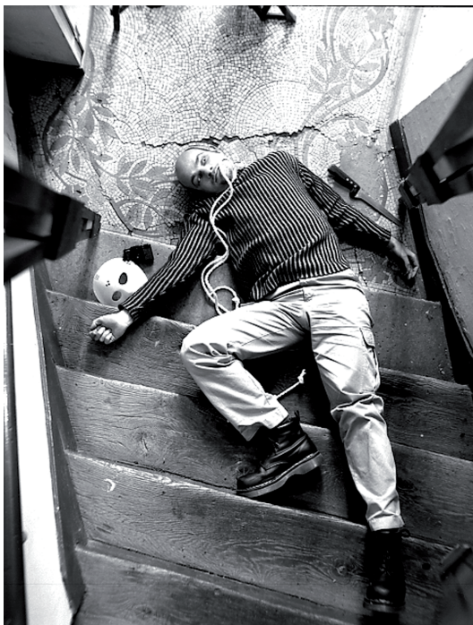
Fig. 5 Yann Toma, Crime du Bataclan - Affaire Yannick Vigouroux , photographie noir et blanc - 220x167cm, 2000.