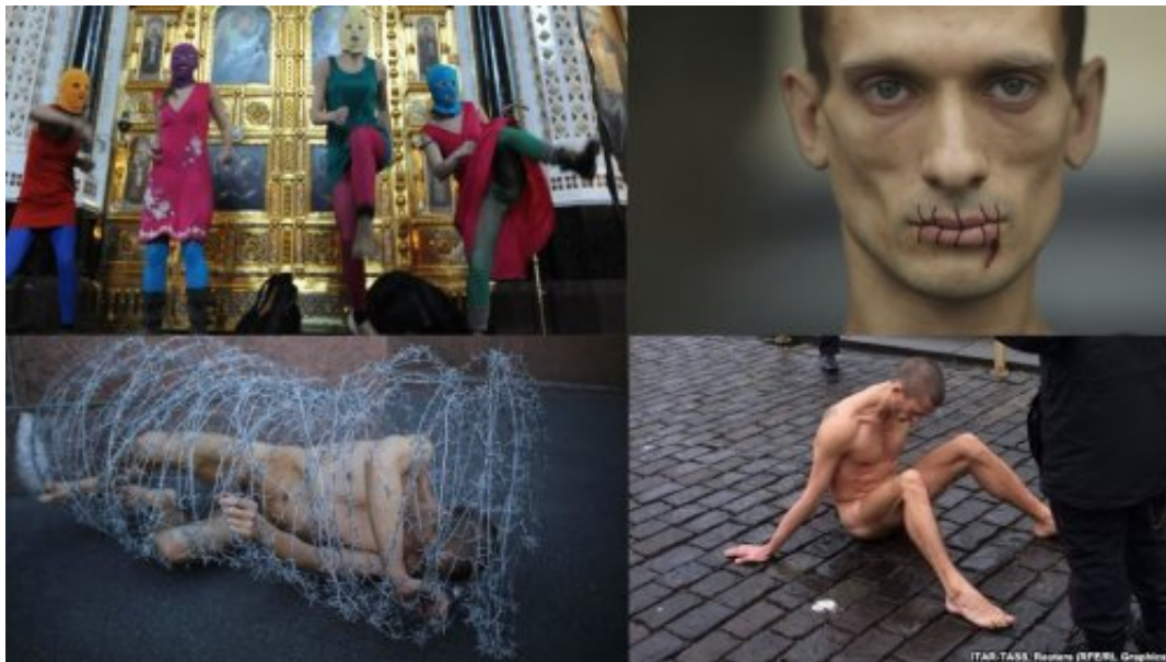
Fig. 5 Pyotr Pavlensky, actions de soutien avec les Pussy Riots, 2013.