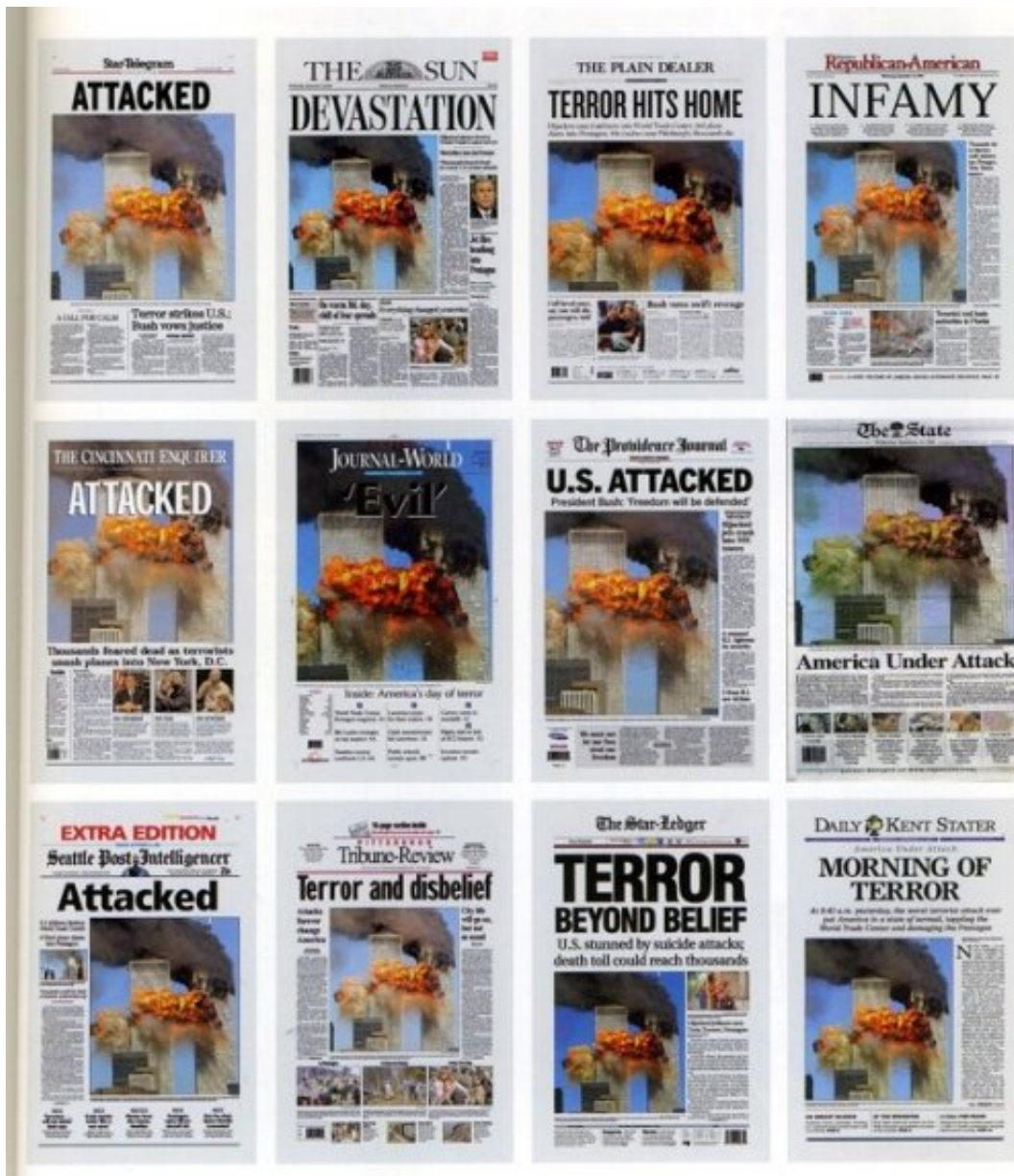
Fig. 7 Couvertures de quotidiens couvrant les attentats du 11 septembre 2001 à NY.