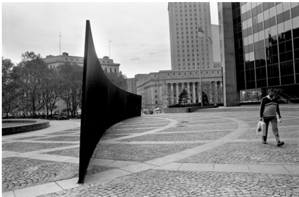
Fig. 9 a,b,c. Richard Serra, Tilted Arc , 1981, New York