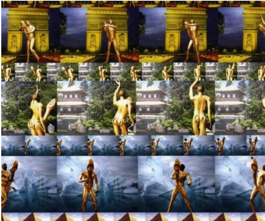
Fig. 13 The Yes Men, Appendice de Visualisation des Employés (APVE), 2001.

celle de placer son siège dans un pays du Sud. Cette annonce provoquera la chute des marchés boursiers et obligera, là encore, le Président de l'OMC à publier un démenti.