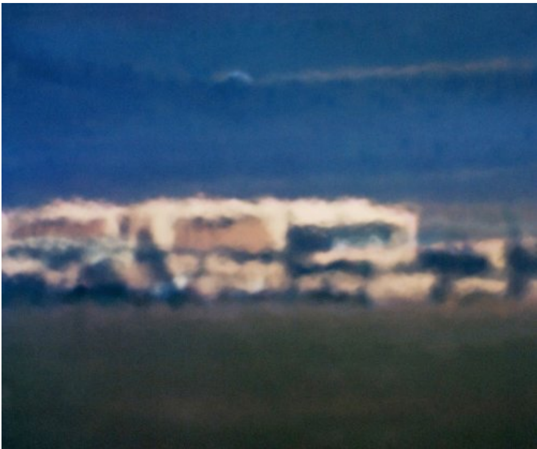
Fig. 15 Trevor Paglen, Open Hangar, Cactus Flats, NV , Distance - 18 miles, 10:04