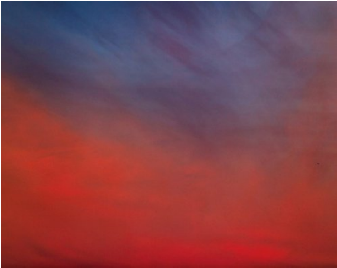
Fig. 14 Trevor Paglen, Untitled (Reaper Drone) , C-Print, 48 x 60 pouces, 2010.