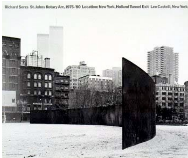
Fig. 11. Richard Serra, St Johns Rotary Arc , New York.

Dans l'édition française des Écrits de Richard Serra on trouve en page 152 une belle photographie de sa pièce St John's Rotary Arc , datant de 1980 et installée, comme Tilted Arc , à New York. Au loin, les tours du World Trade Center se détachent sur le ciel comme deux fantômes. Aujourd'hui, l'arc du rond-point St John est, lui, toujours là puisque, manifestement, le terrorisme a visé une autre cible (Fig. 11).