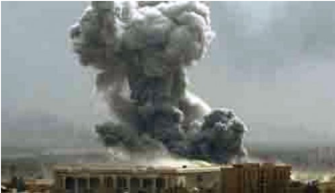
Fig. 6 Thomas Ruff, JPEGNY02, 2004, tirage c-rpint, 269 x 364 cm. NY.

croire puisque nous en avons été submergés (Fig. 7), il y a eu très peu d'images des événements du 11 septembre 2001 puisque le gouvernement américain a interdit aux journalistes de diffuser certaines photographies, principalement celles de cadavres. En dehors de ces vues lointaines dans lesquelles des corps suspendus aux tours jumelles chutent inexorablement vers une issue fatale, les attaques terroristes du 11 septembre 2001 à NY dont on nous dit qu'elles ont entraîné la mort de 3000 personnes, sont des attaques sans cadavres apparents, ce qui renvoie à une stratégie de guerre communicationnelle bien connue : s'il n'y a pas d'images de morts, il n'y a pas de morts, autrement dit, on évite de fournir à l'ennemi un support visuel qui viendrait confirmer son hypothétique triomphe. C'est pourquoi la publication de la photographie The Hand du photojournaliste Tod Maisel a fait scandale puisque ce qu'elle révélait en creux dans cette main coupée trouvée dans les décombres des attentats, c'était le corps mutilé de toute l'Amérique (Fig. 8).