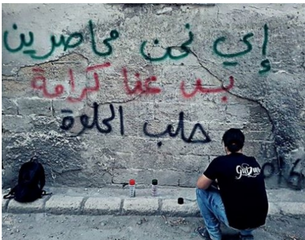
Fig. 16 Image publiée sur la page Facebook de Hozaiifa Dhmaan le 6 octobre 2016, Alep.

Dans un appel lancé aux médias sur les réseaux sociaux, une infirmière du dernier hôpital d'Alep demandait, quelques heures avant que ce dernier ne tombe, que les cadavres ne soient pas montrés de façon à ce que les Syriens puissent garder leur dignité. Sur une autre image d'un graffiti postée par un habitant d'Alep, on lit la phrase suivantes : « إي نحن محاصرين... بس عنا كرامة : Nous sommes assiégés, mais nous restons dignes » (Fig. 16).