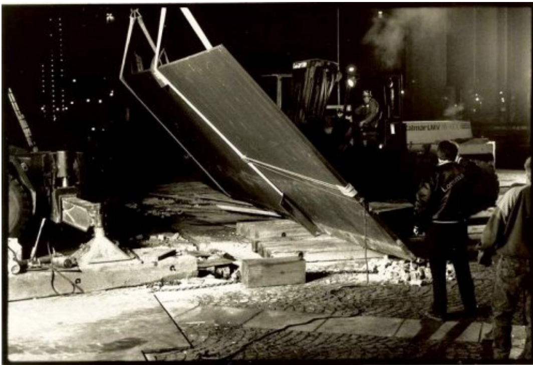
Fig. 10 Démantèlement de Tilted Arc de Richard Serra, 15 mars 1989, New York.

Serra intente un procès contre le gouvernement pour sauver sa sculpture de la destruction, mais il est débouté en 1987. La NEA rend pourtant un rapport explicitant que Tilted Arc doit rester là où elle est car elle est spécifique au site de la Federal Plaza. En 1988, Serra fait appel du jugement mais il est à nouveau débouté. Une photo datant du 15 mars 1989 montre les employés de la GSA détruisant la sculpture au chalumeau en pleine nuit (Fig. 9). Le 17 mars 1989, Diamond déclarera dans le New York Post : « C'est un jour de joie pour le peuple parce que maintenant la piazza lui est rendue de plein droit [4] ». Par-delà le sentiment de révolte que suscite toujours la destruction d'une œuvre, je voudrais souligner les conclusions artistiques, mais surtout politiques que Richard Serra tire de l'affaire.